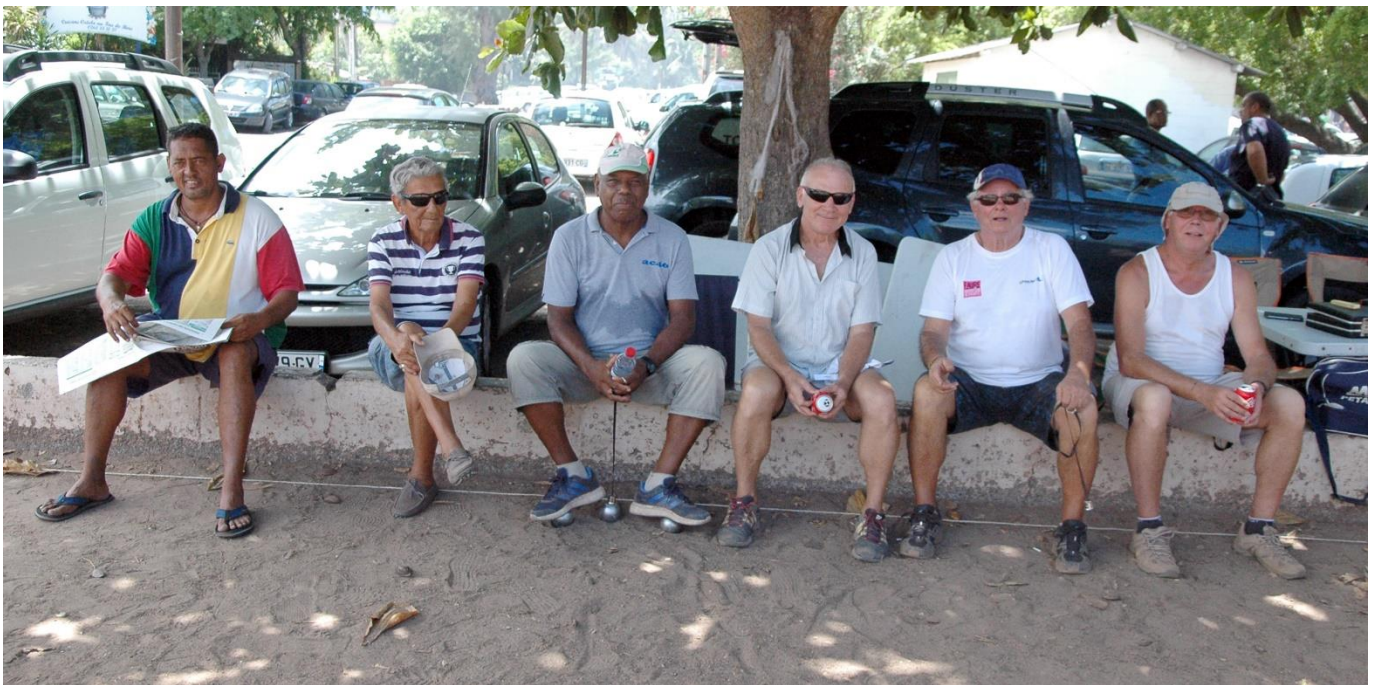
Après l'effort le réconfort