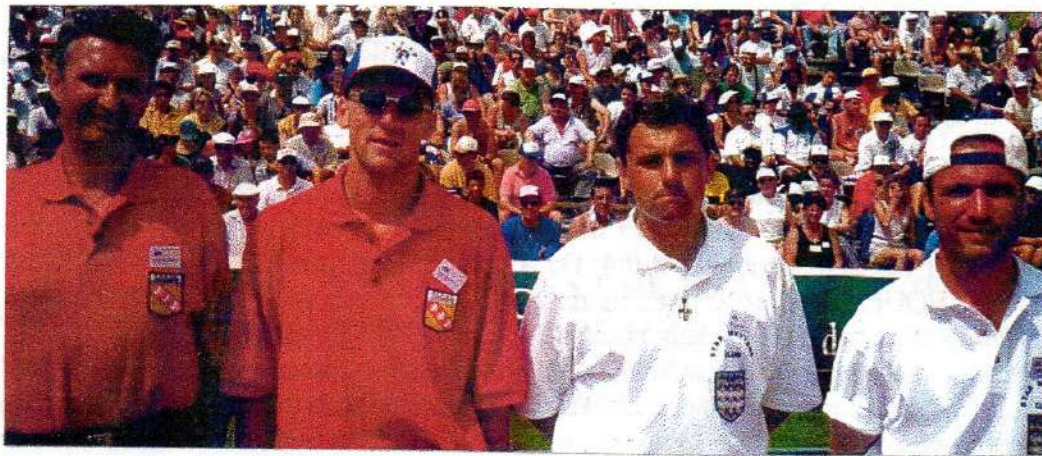
1/2 DOUBLETTES : SEER (54) contre CHOUPAY (77)

Des allées de passage réduites au strict minimum par manque de place, mais surtout un terrain « rouge » pour toute la durée de la doublette et la finale du tête à tête. les spectateurs fulminaient, les joueurs ne décollaient pas, (surtout les perdants) et les médias annonçaient une catastrophe sportive. Même s'il serait dangereux d'en tirer des conséquences pour les futurs championnats, il faut reconnaître que le dénouement de l'édition 1999 des championnats doublettes et tête-à-tête a été somptueux avec la cerise sur le gâteau que constituait la présence des plus forts en finale à deux et la consécration étonnante d'un réunionnais en individuel.