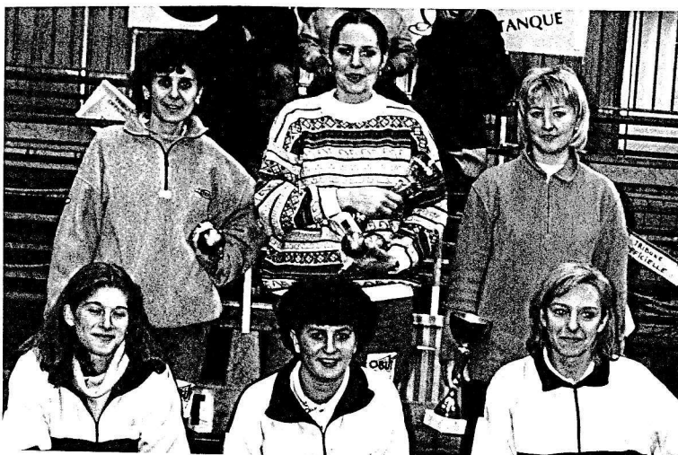
Finale Féminin 2000