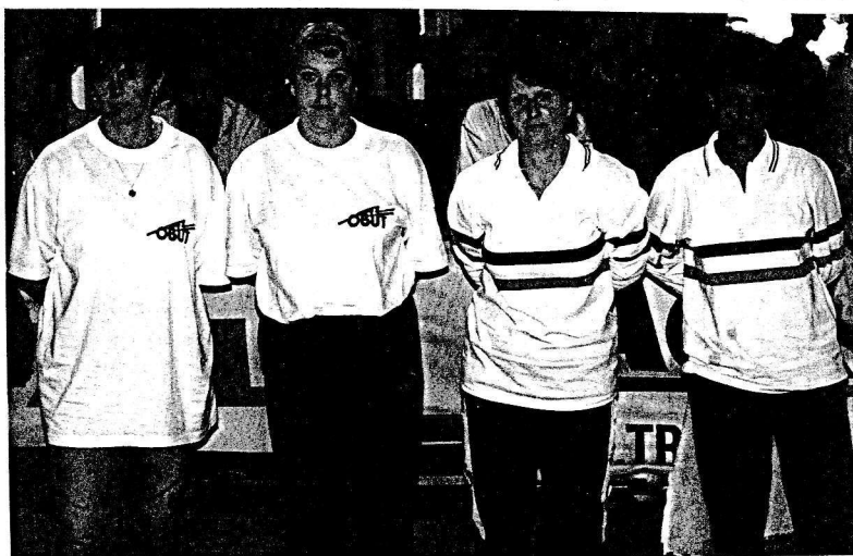
I/2 FINALISTES FEMININES