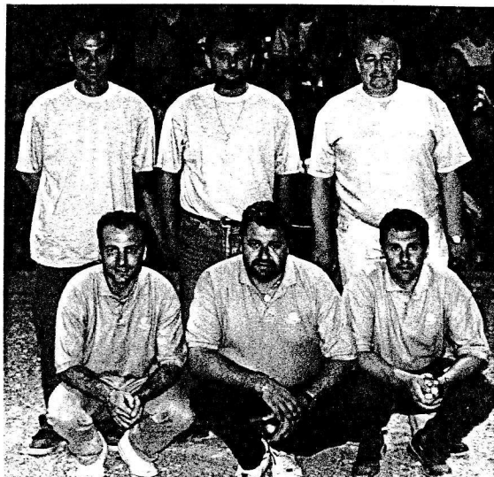
I/2 FINALISTES DU NATIONAL