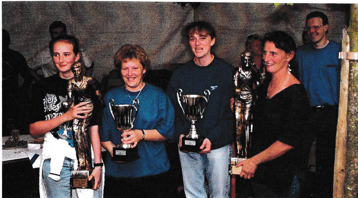
Les vainqueurs du 7 ème National Féminin