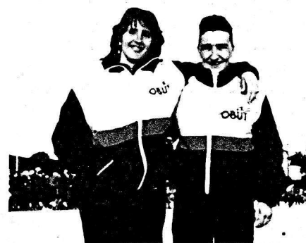
LES DIVINES : L'AMITIE POUR CIMENT