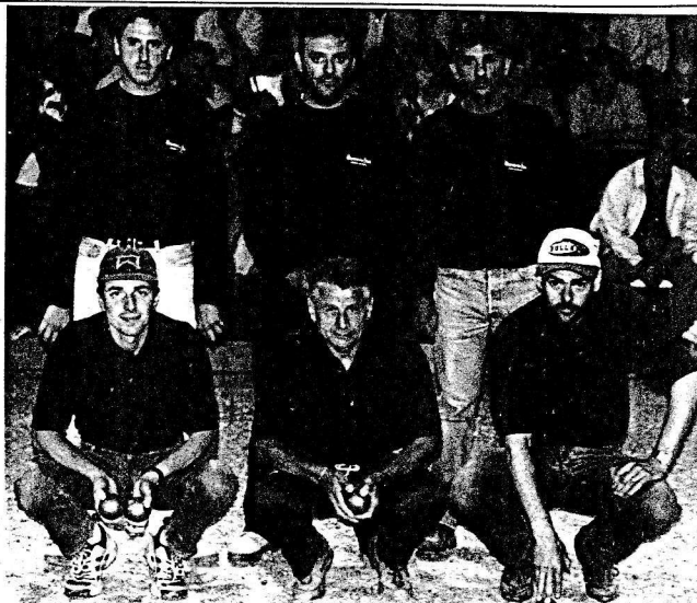
I/2 FINALISTES DU NATIONAL