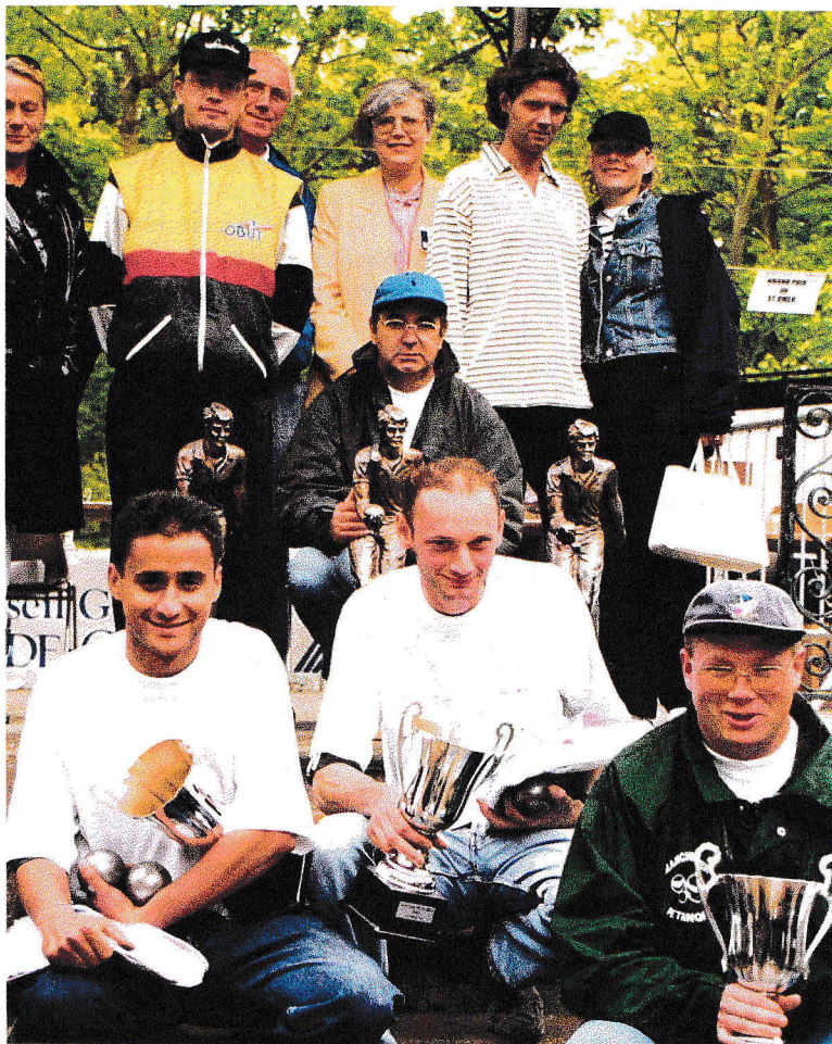
Vainqueurs et finalistes du 8 ème NATIONAL L'Audomaroise

Au cours de cet après-midi, d'autres concours furent proposés aux concurrents, et ce n'est qu'à quatre heures du matin que la dernière équipe se qualifiait pour les huitièmes de finales du National 'L'Audomaroise'. Notons au passage que dans ce National, ni l'équipe Algérienne, ni l'équipe Néerlandaise ne réussirent à se qualifier lors des parties de « poules » et la défaite dès le