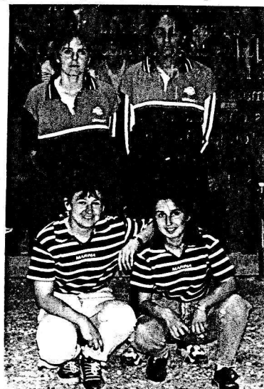
I/2 FINALISTES FEMININES