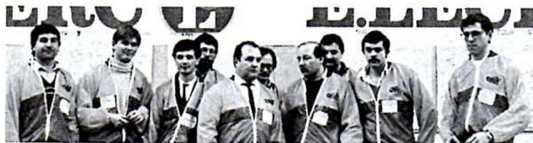
Le Comité d'Organisation aux couleurs de La BOULE OBUT