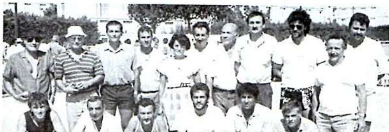
Les Dirigeants de la Boule Amicale du Tivoli avec les Finalistes et les Demi-Finalistes.