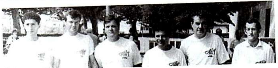
Les Finalistes du "Triplettes" en tee-shirt OBUT.

Quarts de finales : SIMOÈS (Blagnac) bat