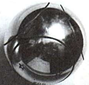
puis striée, marquée trempée, polie et éventuellement chromée

nous sommes bien placés pour vous en parler car nous fabriquons plus de 3.000.000 de boules par an et équipons les plus grands champions