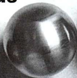
La boule soudée est tournée...