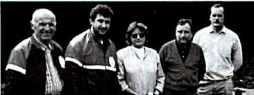
OTELLO et nos amis Anglais.