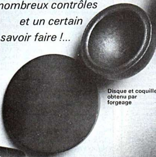
Lopin découpé dans une barre d'acier