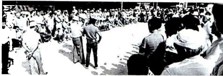
ci-contre, la joie des vainqueurs