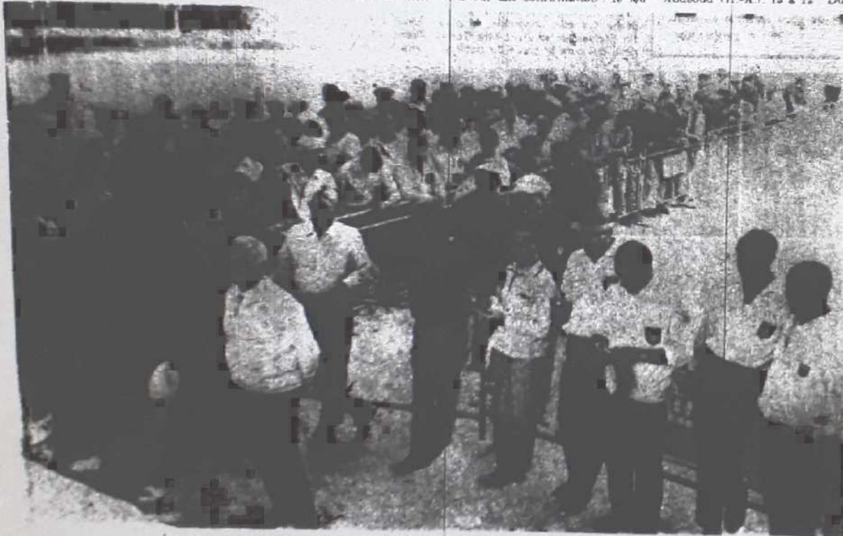
Les joueurs groupés sur le stade Cortier, écoutent les consignes du jury