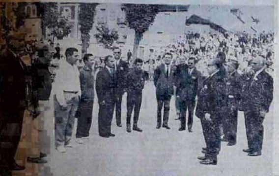
« La Marseillaise » retentit quelques instants avant la finale et elle est écoutée par les dirigeants, joueurs et arbitres (à gauche), par les officiels et dirigeants fédéraux (de face et à droite).