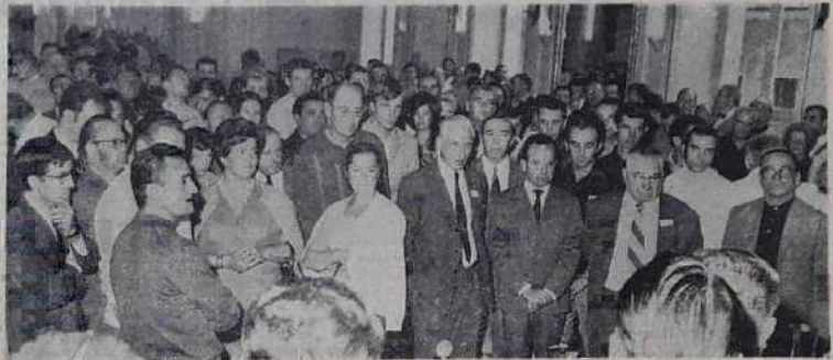
UNE VUE PARTIELLE DES DIRIGEANTS ET JOUEURS PRÉSENTS À LA RÉCEPTION DE LA MUNICIPALITÉ, HIER MATIN