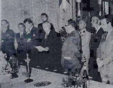
Notre flash sur le groupe officiel, lors de la réception, hier matin, à l'hôtel de ville