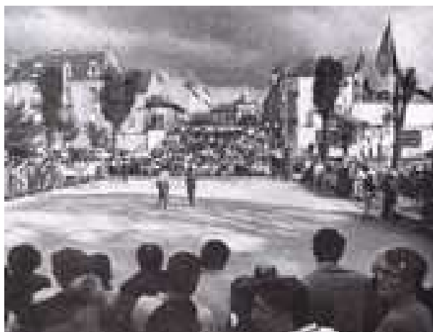
Une vue générale du carré d'honneur de Nevers, juste avant la finale de ce Championnat de France Tête-à-tête

Lors de cette manifestation en 1969, le regretté André Fournier, ne s'imaginait pas que la ville de Nevers en serait 40 ans plus tard, à sa 8 ème organisation d'un Championnat de France pétanque (1969, 1977, 1992, 1996, 2000, 2004, 2005 et 2009).