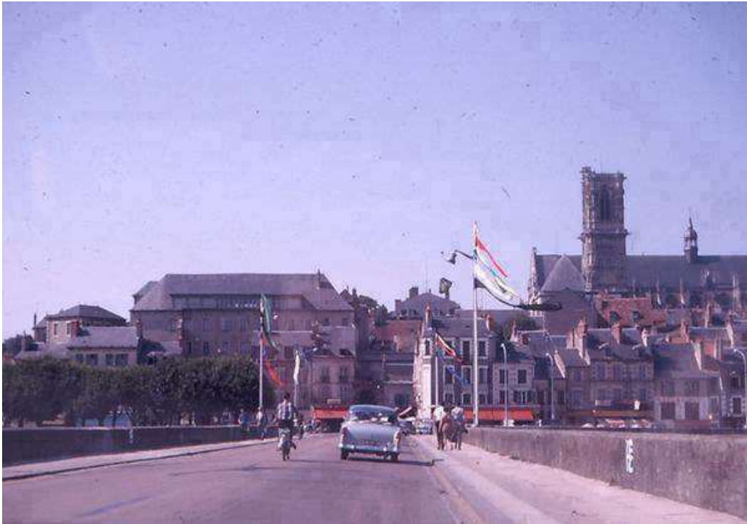
Le pont de Nevers, qui enjambe la Loire, dans les années 60, avec à droite la cathédrale Saint-Cyr

Ce Championnat de France Tête-à-tête senior pétanque , s'est déroulé à Nevers (58) en 1969.