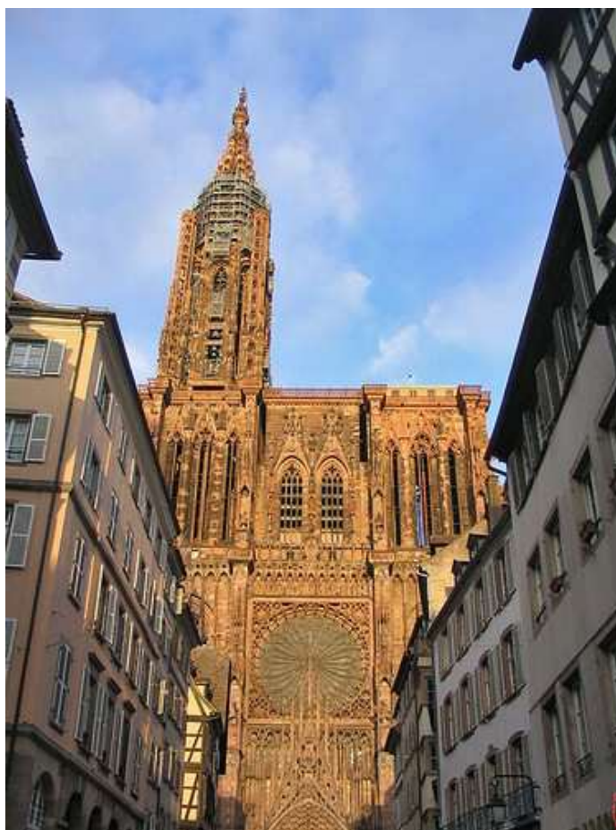
La ville de Strasbourg et sa cathédrale Notre-Dame

Ce Championnat de France corporatif , s'est déroulé à Strasbourg (67) les 19 et 20 juin 1993.