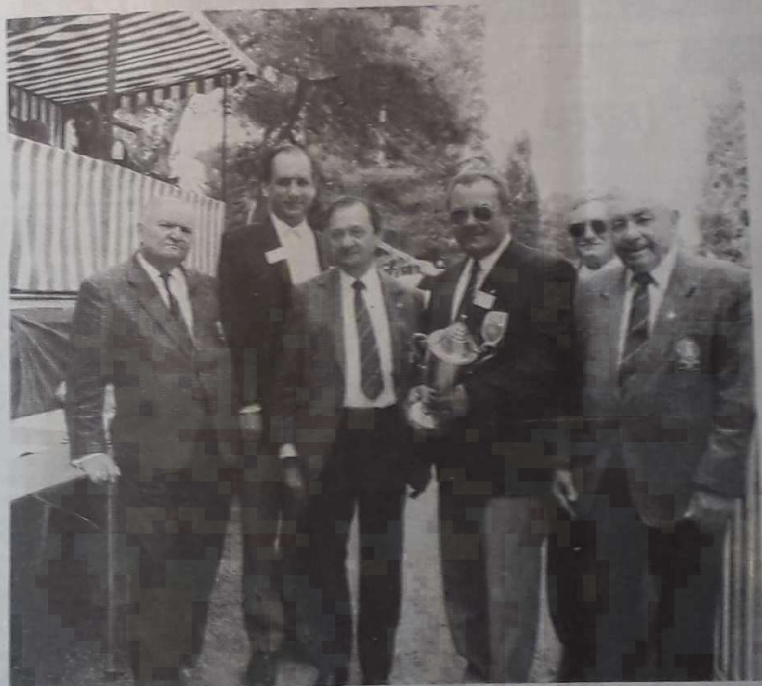
Une coupe prestigieuse, objet des rêves les plus fous des 127 triplettes qualifiées pour ce championnat de France.

Rappelons, en particulier, à l'intention des philatélistes, que deux cartes postales tirées chacune à 500 exemplaires (une avec un dessin de Polonski et une avec un dessin de Verne) seront en vente, de 8 heu-