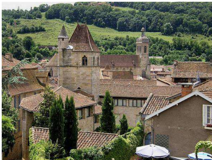
La ville de Figeac, sur les bords du Célé, qui a accueilli ce Championnat corporatif

Ce Championnat de France corporatif , s'est déroulé à Figeac (46) les 15 et 16 juin 1991.