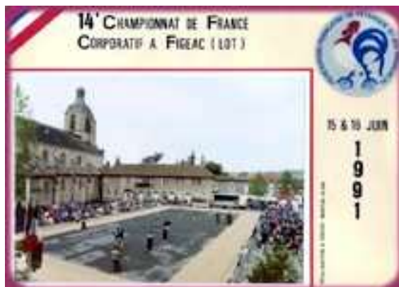
Une vue des phases finales de ce Championnat corporatif à Figeac en 1991 : cette compétition s'est déroulée sous une chaleur suffocante le samedi Quant au dimanche, la pluie a humidifié les terrains implantés face aux Carmes Figeacois