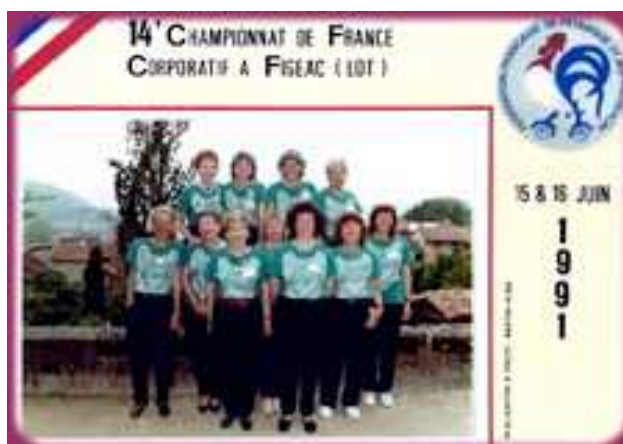
Onze des 13 Dames du Comité d'Organisation de ce Championnat corporatif à Figeac en 1991

Ce Comité d'Organisation, avait pensé à la parité, puisque pas moins de 13 dames en faisaient également partie.