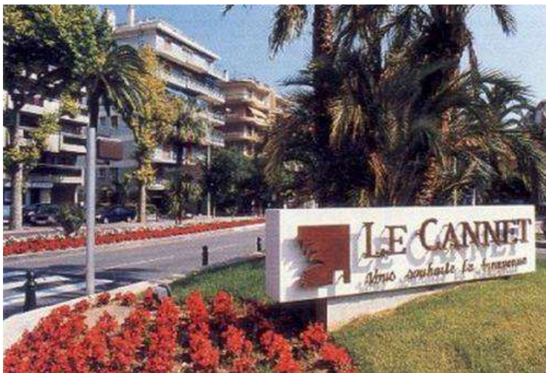
La ville de Cannet qui a accueilli ce 1er trophée national corporatif

Le 1 er Championnat de France corporatif Triplette , en 1978 à Cannet (06), aura été en fait le 1er Trophée National corporatif (jusqu'à sa 3 ème édition en 1980).