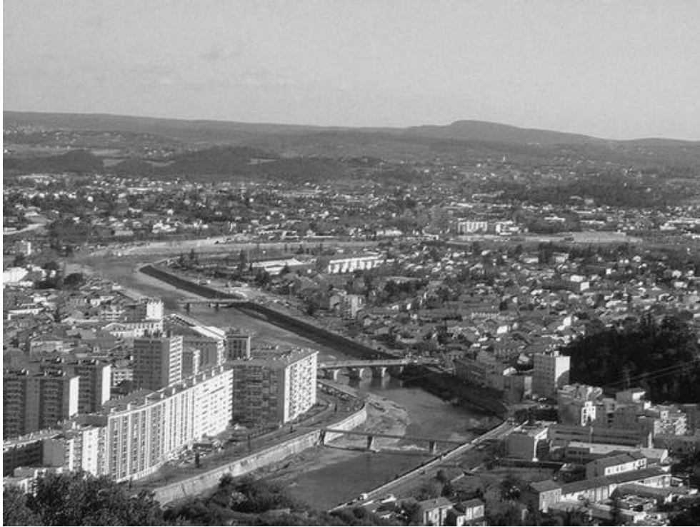
La cité minière d'Alès, qui a été l'hôte de ce Championnat de France pétanque en 1948

Ce Championnat de France Triplette senior pétanque , s'est déroulé à Alès (30), capitale des Cévennes.