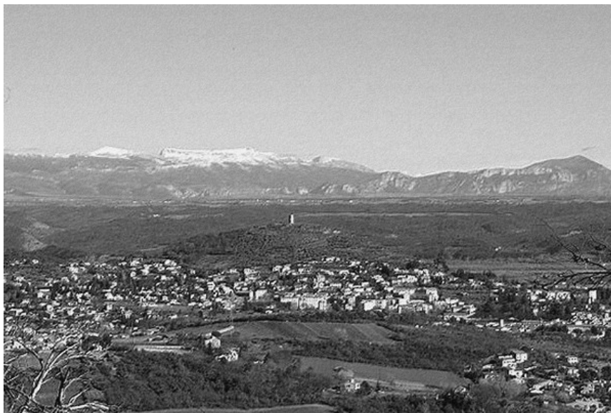
La ville de Manosque dans le Lubéron, qui a accueilli ce Championnat de France de pétanque

Ce Championnat de France Triplette senior pétanque , s'est déroulé à Manosque (04), le dimanche 13 août 1950.