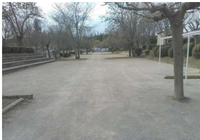
Le boulodrome actuel «La Rochette» de la Boule Manosquine (04)