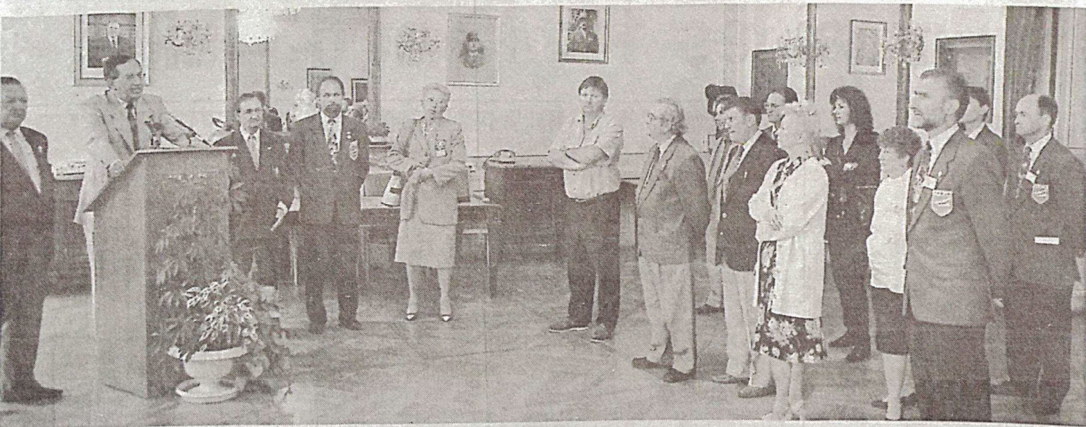
Le trophée national de "Pétanque doublettes" : un événement dans la cité aujourd'hui et demain.

Le grand salon de l'hôtel de ville fleurait bon la Provence dans la soirée d'hier. Les membres du comité de la Fédération française de pétanque, les organisateurs, les arbitres et partenaires du trophée national qui débute