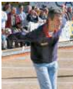
Un Champion du (06)