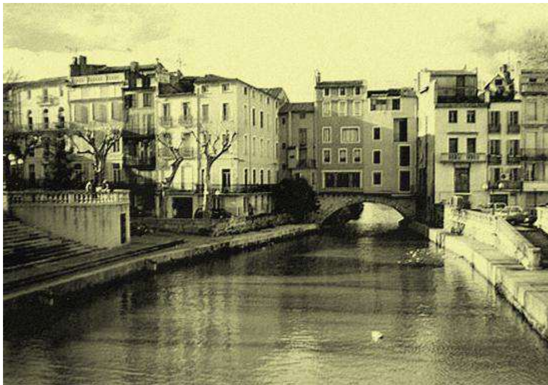
La ville de Narbonne, avec son canal de la Robine et son pont des Marchands

Ce Championnat de France Triplette senior pétanque , s'est déroulé à Narbonne (11), le week-end des 10 et 11 juillet 1954.