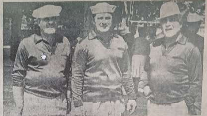
3 équipes toulonnaises.

On attaqua alors les 8èmes de finale avec encore en présence