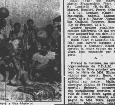
La souris est de rigueur chez les concurrents