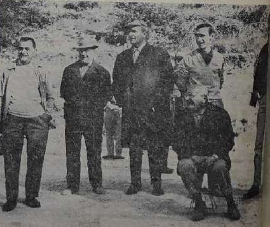
C'est la photo-voyage de la saison tantiste monastérienne. Les six hommes qui sont ici ont fait le plus court de la plus belle vallée des Hautes-Alpes. Ils ont été surpris en route, dans les Alpes, par un vent fort qui les a fait tomber à plusieurs reprises. Mais tout comme Poulain ou autres, les cinq hommes, ils ont tenu bon. Nous leur souhaitons le bon voyage vers les montagnes qui sont les Alpes. Le record a été battu par un habitant de la Courmayeur, de Martigny, et à ses côtés, il a remporté le titre de champion de la Courmayeur. Et enfin, le champion est entré du pays dont il est un enfant. Vous les avez tous, vous pouvez encadrer la photo.