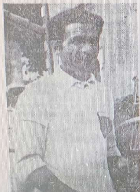
Matraglia qui trouva malheureusement sur sa route, les Brignolais.

« Double » d'autant plus retentissant du fait que nos champions avaient fait le « plein » durant toutes ces parties capitales.