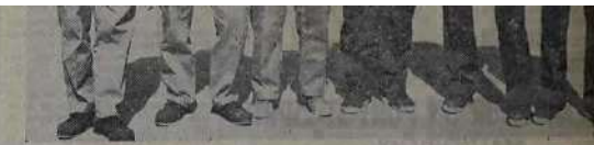
Les Marseillais Fols, Bonissou, Aburo, Del Corso frères et Gué di se sont qualifiés pour la finale de finale.