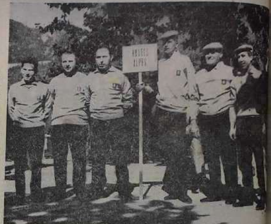
Les équipes des Hautes-Alpes