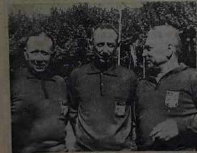
Arno, Pouchy et Scafé, de la Boule Bleue du Luc, vainqueurs hier en un temps record.

vous maintenant que certains d'entre eux ne connaissent dans le sport, même si parfois cela doit être le sport de la vie !