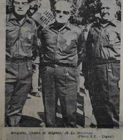
Bouquins, Chaîne et Magnan de La Brillanne

Mar-déjà pourtant nous avions pris du retard puisque un fait ce tirage au sort allait commencer aux environs de 9 h. Par voie de conséquence, le rassemblement était tardif lui aussi.