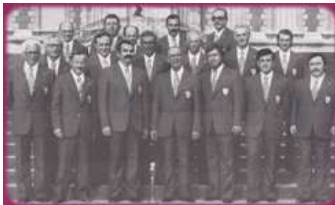
Le Comité d'Organisation de ce Championnat de France à Bagnex (92) en 1978