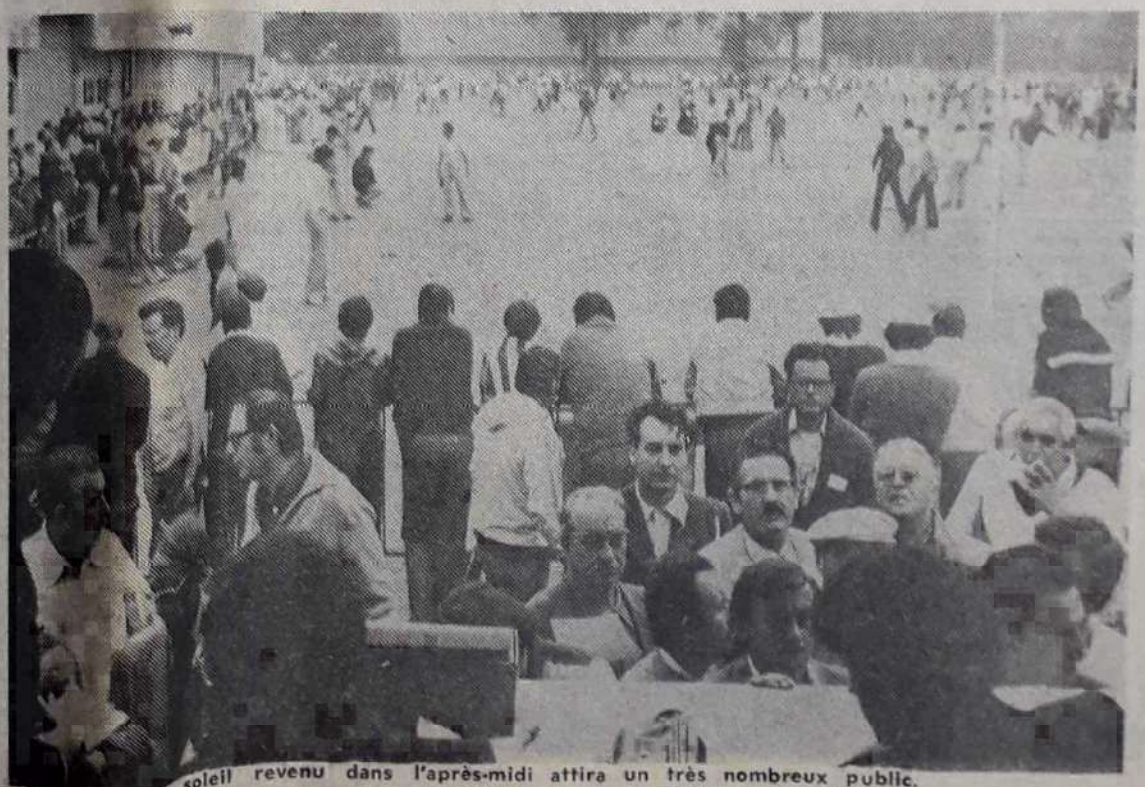
Le soleil revenu dans l'après-midi attira un très nombreux public.