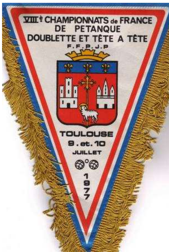
Le fanion de ce Championnat de France pétanque à Toulouse en 1977

Ce 8 ème Championnat de France Doublette senior, s'est déroulé les 9 et 10 juillet 1977 à Toulouse (31).