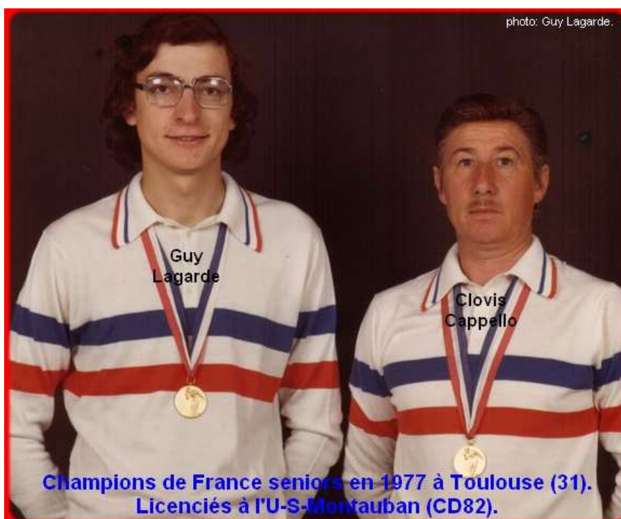
Champions de France seniors en 1977 à Toulouse (31). Licenciés à l'U-S-Montauban (CD82).

Le club de l'U-S Montauban (section pétanque), Champion de France 1977, est le même que celui de l'U-S-M (section rugby) qui a remporté 10 ans auparavant, le bouclier de Brennus en 1967 à Bordeaux, face à Bègles.