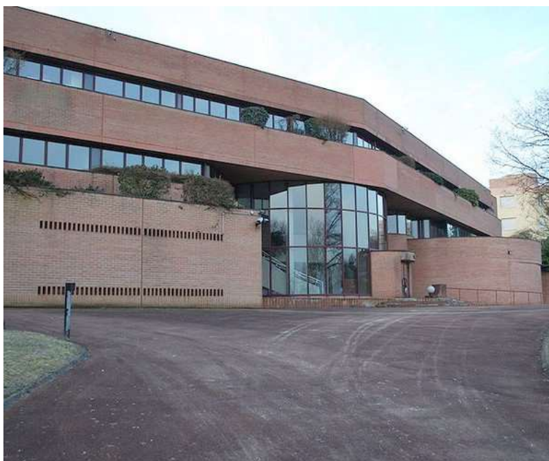
Le bâtiment du Centre National d'Information Routière (le fameux Bison-Futé) implanté à Rosny-sous-Bois

Ce Championnat de France Doublette senior , s'est déroulé les 6 et 7 juillet 1996 à Rosny-sous-Bois (93).