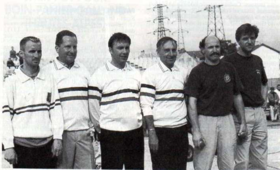
Le podium des championnats de France doublette et tête à tête.