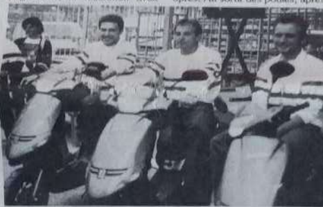
Les champions de France triplette chevauchant leur cadeau de champion.

Bien entendu, comme chaque année, nos meilleurs représentants étaient présents et la lutte pour le plus suprême s'avérait des plus âpres. Au sortir des poules, après