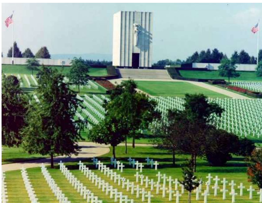
Le cimetière Américain de Saint-Avoid, avec plus de 10000 tombes de soldats US, tombés pendant la seconde guerre mondiale, sur le front du Rhin

Ce Championnat de France Doublette senior , s'est déroulé les 2 et 3 juillet 1994 à Saint-Avoid (57).