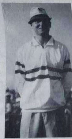
Champion de France tête à tête.