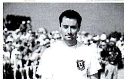
De gauche à droite et de haut en bas.