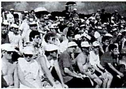
La foule est au rendez-vous.

n'épargne pas l'équipe d'Eure-et-Loir et qui constitue là encore une finale avant la lettre.