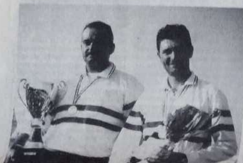
Champions de France doublette.

Il n'est plus besoin de présenter la ligue de Lorraine et le comité de Moselle, car notre ami Cartierelli est un joyeux récidiviste. Car si les comités sudistes se font particulièrement têter l'oreille pour prendre en charge l'organisation d'une épreuve nationale, les gars de l'Est eux sont toujours prêts à assumer cette tâche, prouvant ainsi un sérieux dynamisme. Et l'on sait par expérience que l'organisation sera parfaite et que rien ne sera laissé au hasard.