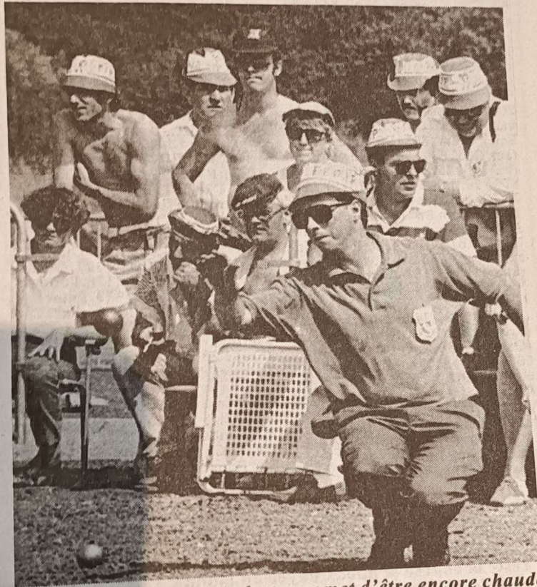
La lutte promet d'être encore chaude aujourd'hui dans la cité naborienne

Le Meurthe-et-Mosellan Cabaret est également à créditer d'un exploit puisqu'il est aussi qualifié grâce à sa victoire Schwartz (Belfort).