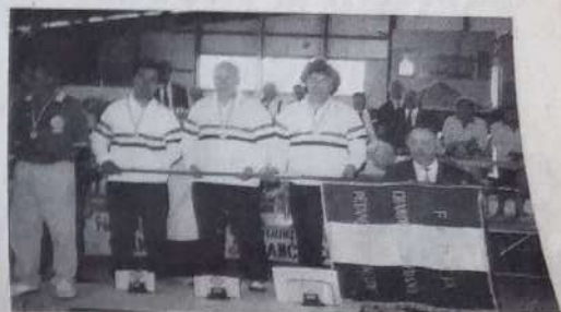
Champions de France corpo.