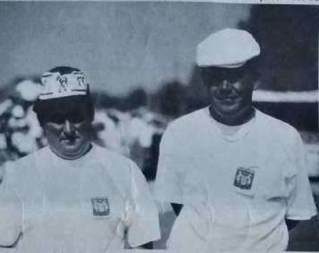
Vice-champions de France doublette.

les ex-champions du monde s'échappent et s'imposent logiquement 13 à 6.