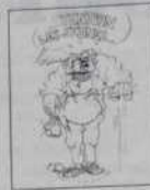
Réf. T 02