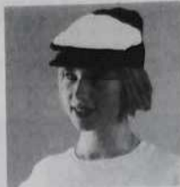
Casquette bouliste - Réf. C01 multicolore ou blanche 30 francs ou 3 bons parrainage