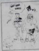
Réf. T 01