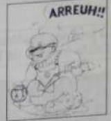
Réf. T 05