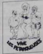
Réf. T 04