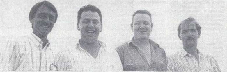
L'équipe ardonnaise au grand complet.