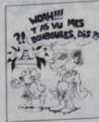
Réf. T 03