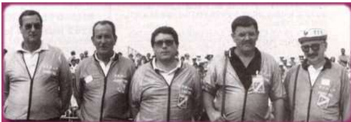
Le corps arbitral de ce Championnat de France pétanque en 1991 à Reims (51)