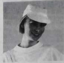
Casquette base-ball - Réf. C02 blanche, blanc/jaune blanc/bleu, blanc/rouge, orange 15 francs ou 1 bon parrainage