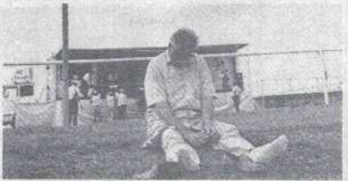
Déception quand tu nous tiens.