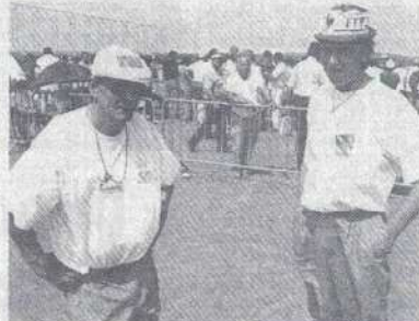
Carrey-Moucheron : la paire régionale est sortie très déçue de ces championnats 91.