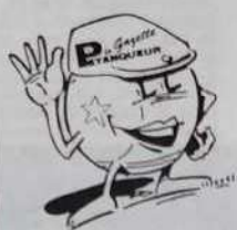
Dessin figurant sur les 3 articles ci-contre

Tailles: S/M - L - XL: 80 Francs ou 8 bons parrainage de 2 à 14 ans: 60 Francs ou 6 bons parrainage