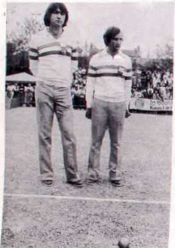
Foyot-Stéphani : les Parisiens tenants du titre ont chuté en quart de finale