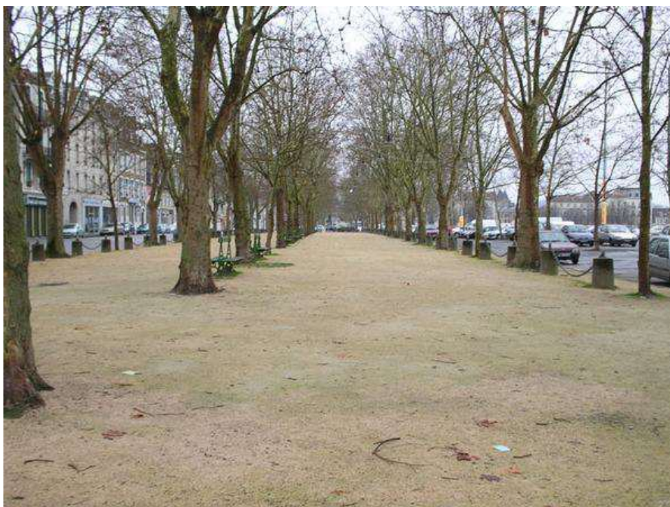
La Place de Verdun à Pau, où s'est déroulé ce Championnat de France en 1981 et où les Paloïis taquent quotidiennement la petite boule

Ce Championnat de France Doublette senior , s'est déroulé les 4 et 5 juillet 1981 à Pau (64), patrie du Roi Henry IV «Nouste Henric».