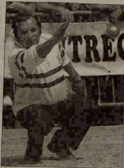
Sarda-Schatz seront encore là aujourd'hui en huitièmes pour défendre leur titre 97.