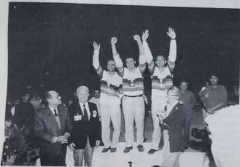
Les Franciliens, champions du monde

L'organisation d'un championnat du monde est toujours un défi. Mais lorsque c'est la France qui le relève cet événement devient alors un symbole. Car dès lors on mesure, avec la venue d'équipes des cinq continents, le chemin parcouru depuis ce mois de juin 1910 où un certain Ernest Pittot proposa à son ami Jules Lenoir perdu de rhumatismes de faire une partie à courte distance en plaçant les pieds joints dans un cercle.