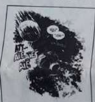
Réf.: T 07