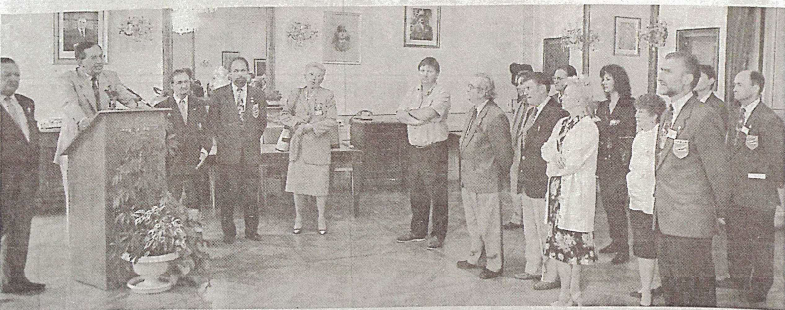
Le trophée national de "Pétanque doublettes" : un événement dans la cité aujourd'hui et demain.

Le grand salon de l'hôtel de ville fleurait bon la Provence dans la soirée d'hier. Les membres du comité de la Fédération française de pétanque, les organisateurs, les arbitres et partenaires du trophée national qui débute