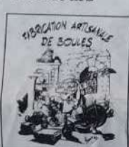
Réf.: T 08