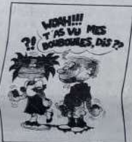
Réf.: T 03

TEE-SHIRTS 100 % coton imprimés en 3 couleurs