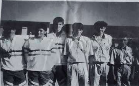
Champions et vice-champions juniors.

pouvait commencer. Difficile ici de suivre toutes les parties, mais au fil des jeux j'ai pu voir la détresse des uns et l'assurance des autres, des déconvenues cinglantes et de vrais exploits, des minois consternés et des explosions de joie. Dans ces catégories d'âges, chaque partie est un véritable petit drame qui se joue. L'œil du coach et la présence des parents venant encore augmenter la sensibilité des participants. Témoin cette partie