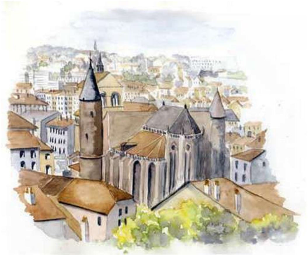
Epinal et sa basilique Saint-Maurice (aquarelle de Claude Papkoff-Tollard)

Le 2 ème Championnat de France Doublette mixte , en 1994 à Epinal (88), aura été en fait le 2 ème et dernier Trophée National mixte (à partir de 1995, il deviendra Championnat de France Doublette mixte).