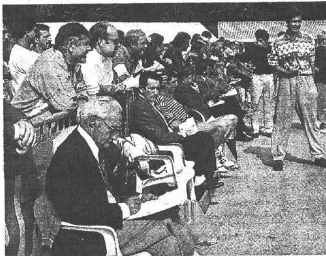
Un public de connaisseurs.