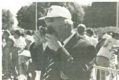
Photo souvenir au pied du Fort Hatry.