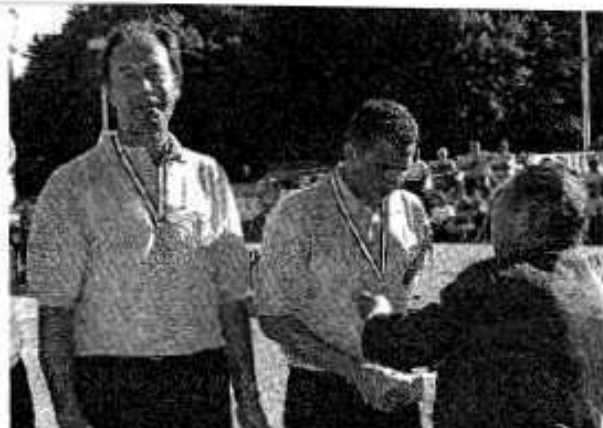
L'équipe des Bouches-du-Rhône, déçue à perdu face à celle de Melun.