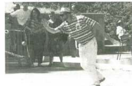
Un Belfortain à l'œuvre, devant une poignée de supporters.

A la faveur d'une cagna frisant les 30°C, les premières épreuves du championnat de France doublettes de jeu provençal ont démarré hier. Ambiance... méridionale.