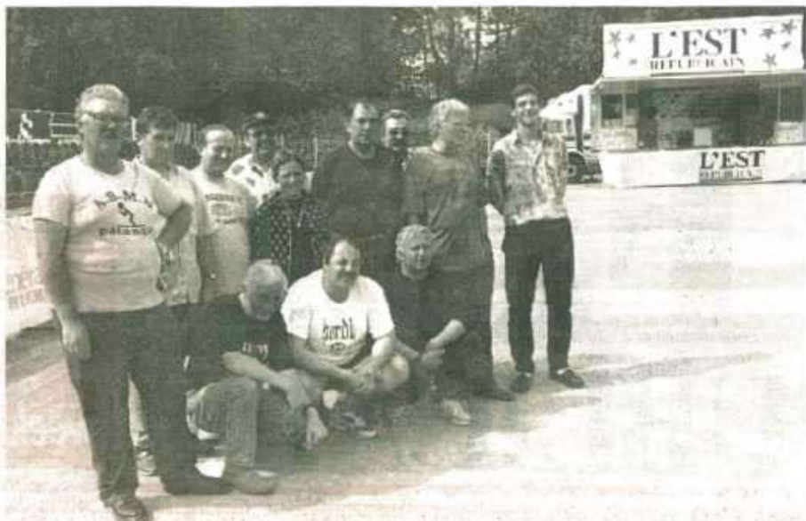
Les bénévoles ont terminé la préparation du boulodrome du Fort Hatry.

A 24 heures de l'ouverture du championnat, les premières équipes ont foulé le sol belfortain hier matin. Arrivées de Charentes-Maritime, du Nord, de l'Isère, de la Gironde, des Pyrénées orientales, c'est sous le soleil qu'elles