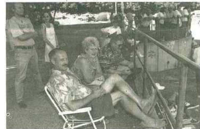
« Nous sommes venus encourager les Haut-Saônois. »

Domage trop fort. « Que voulez-vous, je ne sens pas ma force ! »