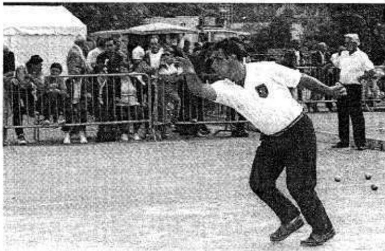
En haut à gauche: le public toujours de la partie.