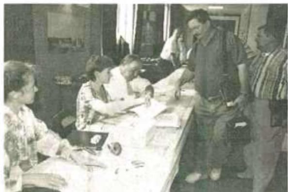
Accueil des participants à la salle des fêtes de Belfort.

Les bénévoles du comité départemental de pétanque et de jeu provençal ont mis hier après-midi la touche finale à plusieurs jours de préparation. Un championnat de France, ça ne s'improvise pas!