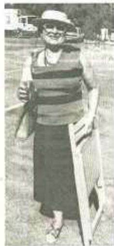
« Mon cousin de Toulouse est là, et il gagne ! »