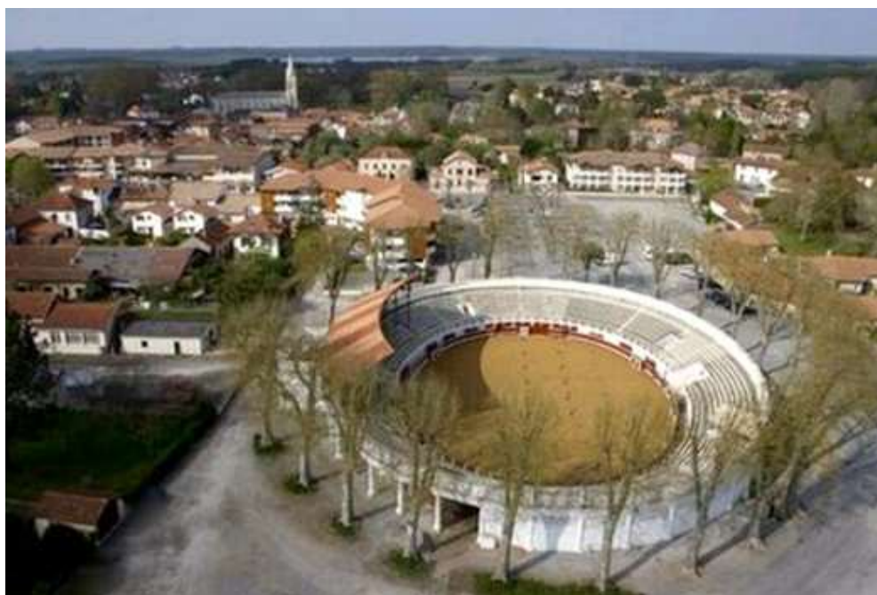
Les arènes de Soustons, où se sont déroulées les phases finales, de ce Championnat de France féminin en 2001

La ville de Soustons (40), a été l'hôte de ce Championnat de France Doublette féminin.