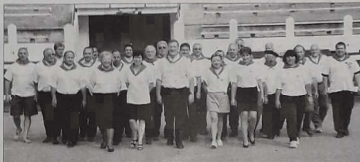
Organisation d'expérience pour le comité directeur landais qui organise un quatrième championnat de France

gneront sans partage sur le bouledrome avant de briguer dans les arènes le titre de championnes de France.