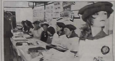
Hôtesse avec bérêts du Sud-Ouest

Coiffées de bérêts rouges, de souriantes hôtesse proposaient de nombreux articles promotionnels sur le thème de la pétanque et du sud-ouest de la France. Un accueil de charme auquel succombèrent bien des participants et spectateurs.