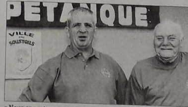
« Nous apportons notre quote-part à ce championnat de France de féminines en doublettes »

La participation du club à l'événement commençait dès le début de l'année avec la recherche d'annonceurs indispensables à l'édition de la plaquette. Aucun des neuf membres du bureau du club ne se trouvait exempté du démarchage. « Les résultats ont dépassé nos espérances. Nous avons reçu un ac-