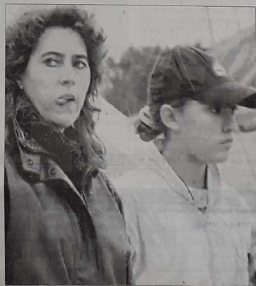
L'équipe de Saint-Sever