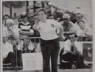
Les féminines représentent 14 % des effectifs licenciés en France, et 18 % dans les Landes