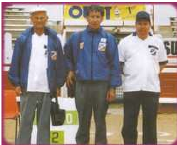
Les arbitres qui ont officié lors de ce Championnat de France féminin, à Soustons en 2001