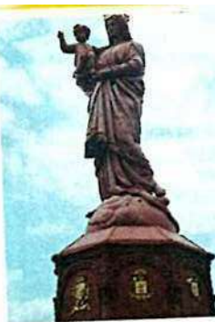
Notre-Dame du Puy