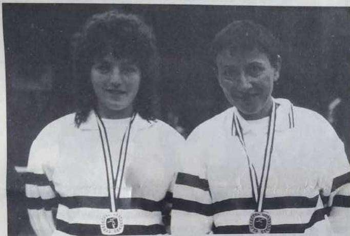
Les championnes de France arborant leurs nouveaux maillots et les médailles d'or de la F.F.P.J.F.