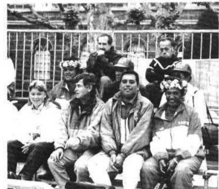
La délégation venue de Polynésie a été rapidement adoptée par le public puyot.

● Au total, 254 joueuses ont répondu à l'invitation lancée par la ligue régionale Auvergne-Bourbonnais et par le comité de Haute-Loire de pétanque.