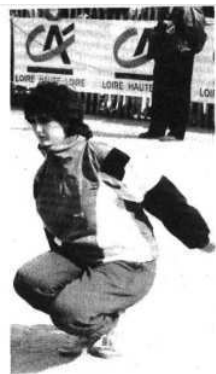
Gelin : elle n'aura pas réussi le doublé championnat du monde - championnat de France.

(Gironde) bat Morin (Deux-Sèvres) ; Deguy (Limousin) bat L'hôpital (Yvelines) ; Ferradou (Haute-Garonne) bat Dubouchaud (Haute-Vienne) ; Marchand (Hérault) bat Rybak (Saône-et-Loire) ; Kouadri (Rhône) bat Furman (Pas-de-Calais) ; Tissier (Cher) bat Carbillet (Seine-et-Marne) ; Buttoia (Oise) bat Hochard (Nord-Picardie) ; Gros (Var) bat Doom (Polynésie).