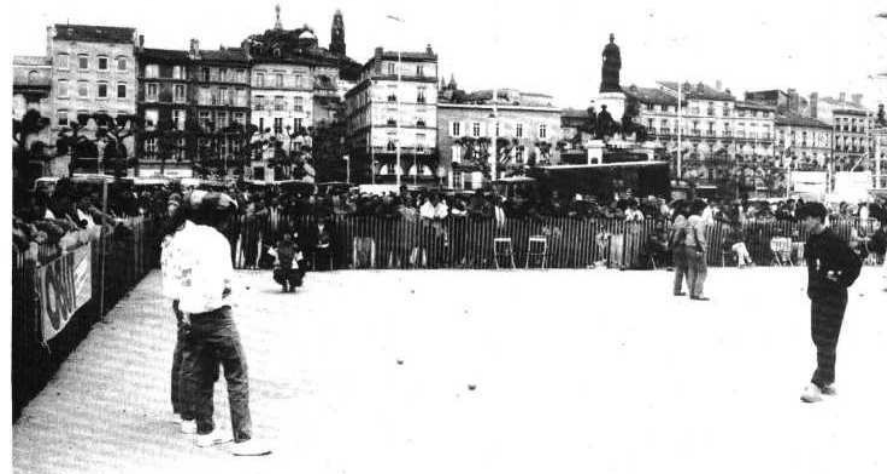
Vue générale de la place du Breuil.

● HUMOUR... QUAND TU NOUS TIENS !! Entendu, sous forme de devinette, dans un groupe de personnes apparemment sérieuses : - Quel est le plus beau rêve d'une boule de pétanque ? - L'amour des suçons... et la vie à la colle avec le but. Un rêve... cochonnet !!