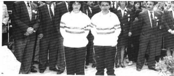
Les deux championnes viennent de revêtir le maillot tricolore. Au second plan, le comité d'organisation presque au grand complet.