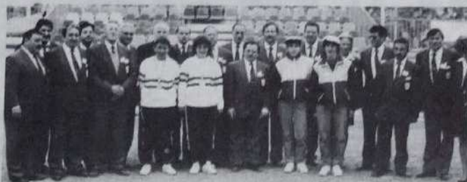
Les finalistes et le comité.