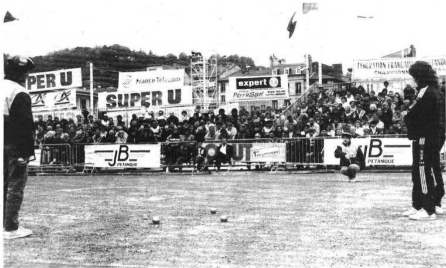
La finale dans le carré d'honneur : une partie pleine de tension. Les joueuses de Montpellier sont à droite.