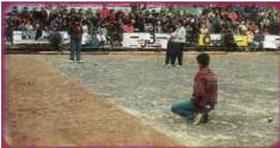
Une rencontre de 1/4 de finale, qui a opposé le (31) au (69) en 1994 au Puy-en-Velay