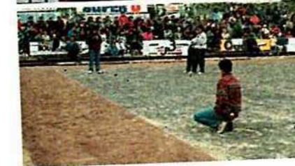
De haut en bas :