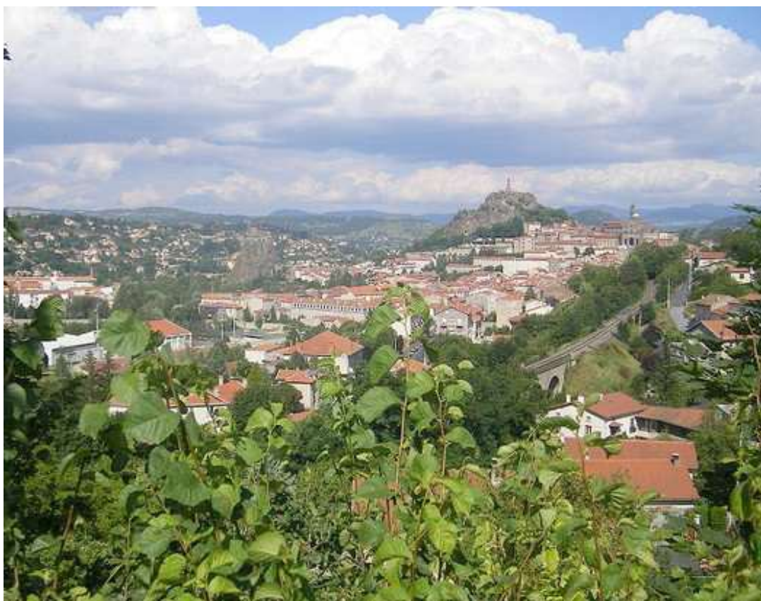
La ville du Puy-en-Velay, qui est le point de départ de la Via Podiensis, un des itinéraires du pèlerinage des Chemins de Compostelle

C'est la ville du Puy-en-Velay (43), qui a été l'hôte de ce Championnat de France féminin pétanque.