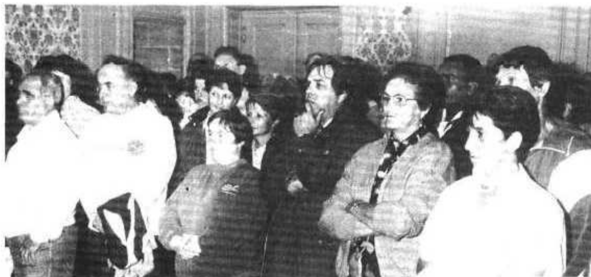
Une assistance nombreuse avait envahi la salle des mariages.

LE PUY EN VELAY 10-11-12 JUN 1994 CHAMPIONNAT DE FRANCE FEMININ