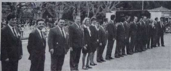
Le comité organisateur au grand complet.

Reste à féliciter l'équipe organisatrice pour la qualité de son accueil et l'excellent déroulement de ces championnats. Bravo encore d'avoir réussi à trouver des terrains en pleine ville.