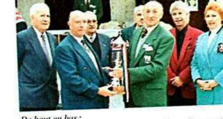
De haut en bas :