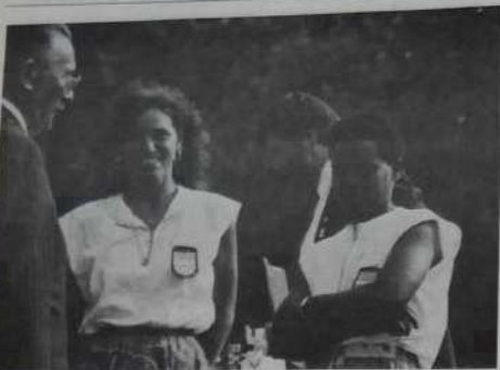
Vice-championnes de France.

nes); Rathberger bat Collombet (Ain); Stavelot bat Gros (Bouches-du-Rhône).