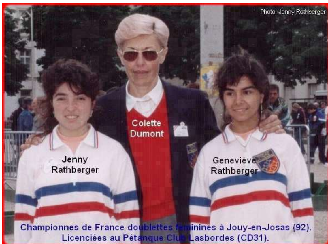
Championnes de France doublettes féminines à Jouy-en-Josas (92). Licenciées au Pétanque Club Lasbordes (CD31).

Après une 1/2 finale en 1990, puis une finale en 1991, c'est une superbe et logique victoire, pour ces 2 poupées Toulousaines en 1992.