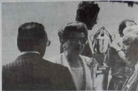
Madame le maire de Jouy-en-Josas.