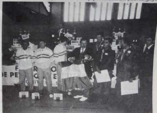
Les finalistes à la remise des prix

Dans les demi-finales, les quatre équipes semblaient pouvoir gagner