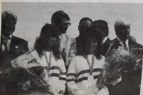
Championnes de France.