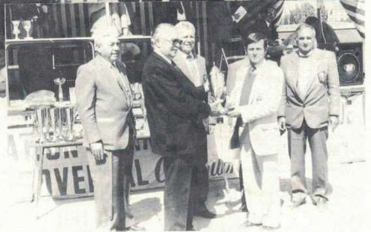
Le passage du flambeau

• Les championnes en titre sont opposées à Sarda-Coros de l'Hérault, championne de la ligue Languedoc-Roussillon. Une partie dont on attend beaucoup tant la prestation des deux équipes avait été excellente au cours des tours précédents. Malheureusement l'équipe Seine-et-Marnaise d'emblée ne trouvera pas son rythme et les joueuses de l'Hérault prirent rapidement un