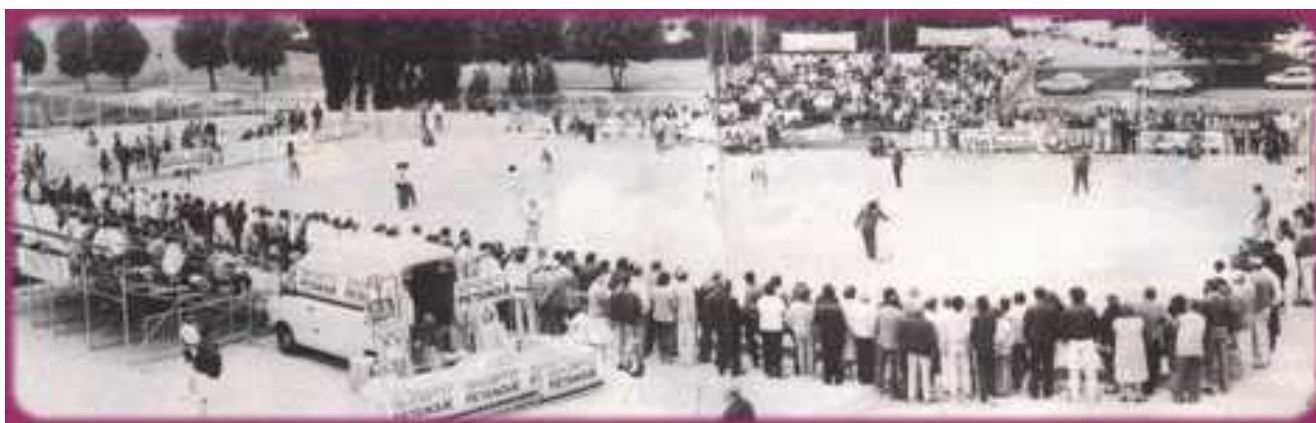
Une vue générale des terrains d'honneur de ce Championnat féminin à Créteil en 1986