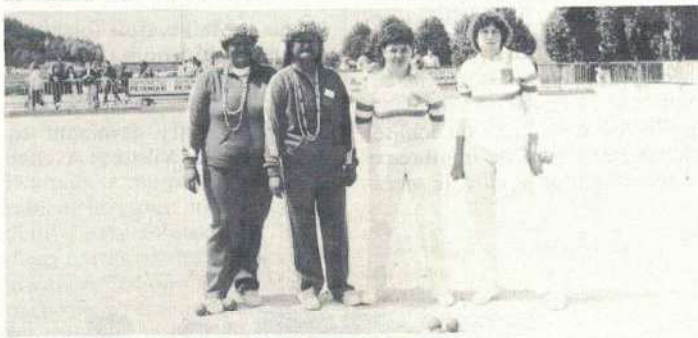
L'équipe de Polynésie et les championnes sortantes