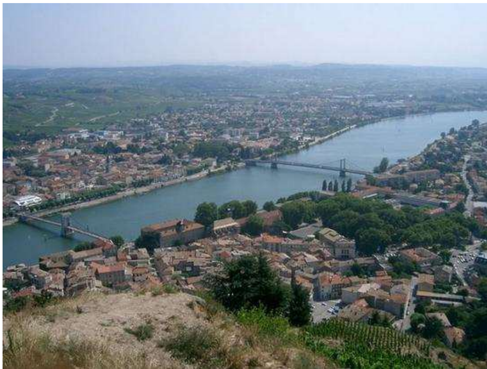
Une vue générale de la ville de Tournon-sur-Rhône en Ardèche. Sur l'autre rive du fleuve, la cité de Tain-l'Hermitage co-organisatrice de ce Championnat

C'est la ville de Tournon-sur-Rhône en Ardèche, qui a été l'hôte de ce Championnat de France féminin pétanque.