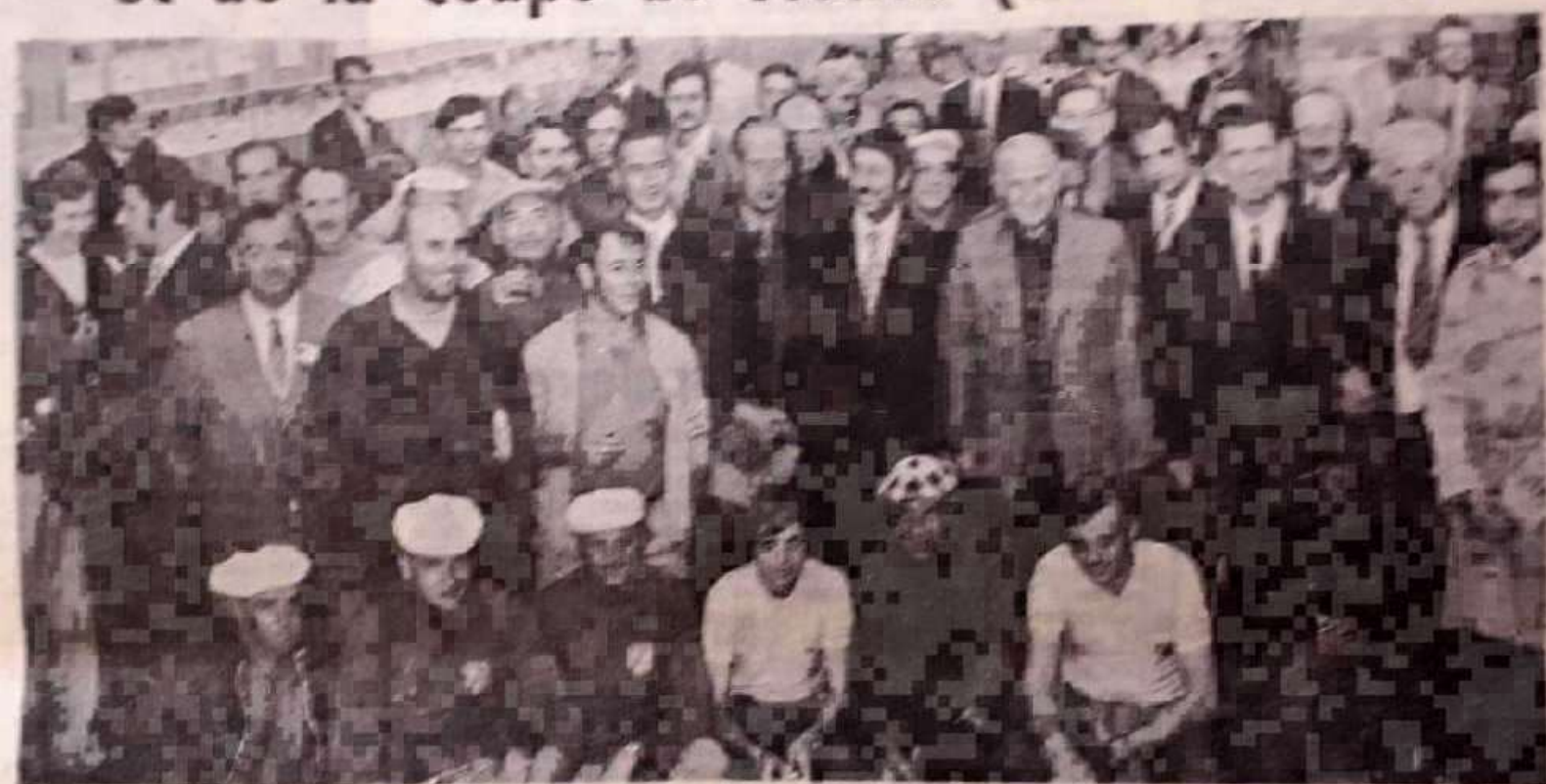
Une vue des officiels, concurrents et dirigeants lors de l'apéritif d'honneur.