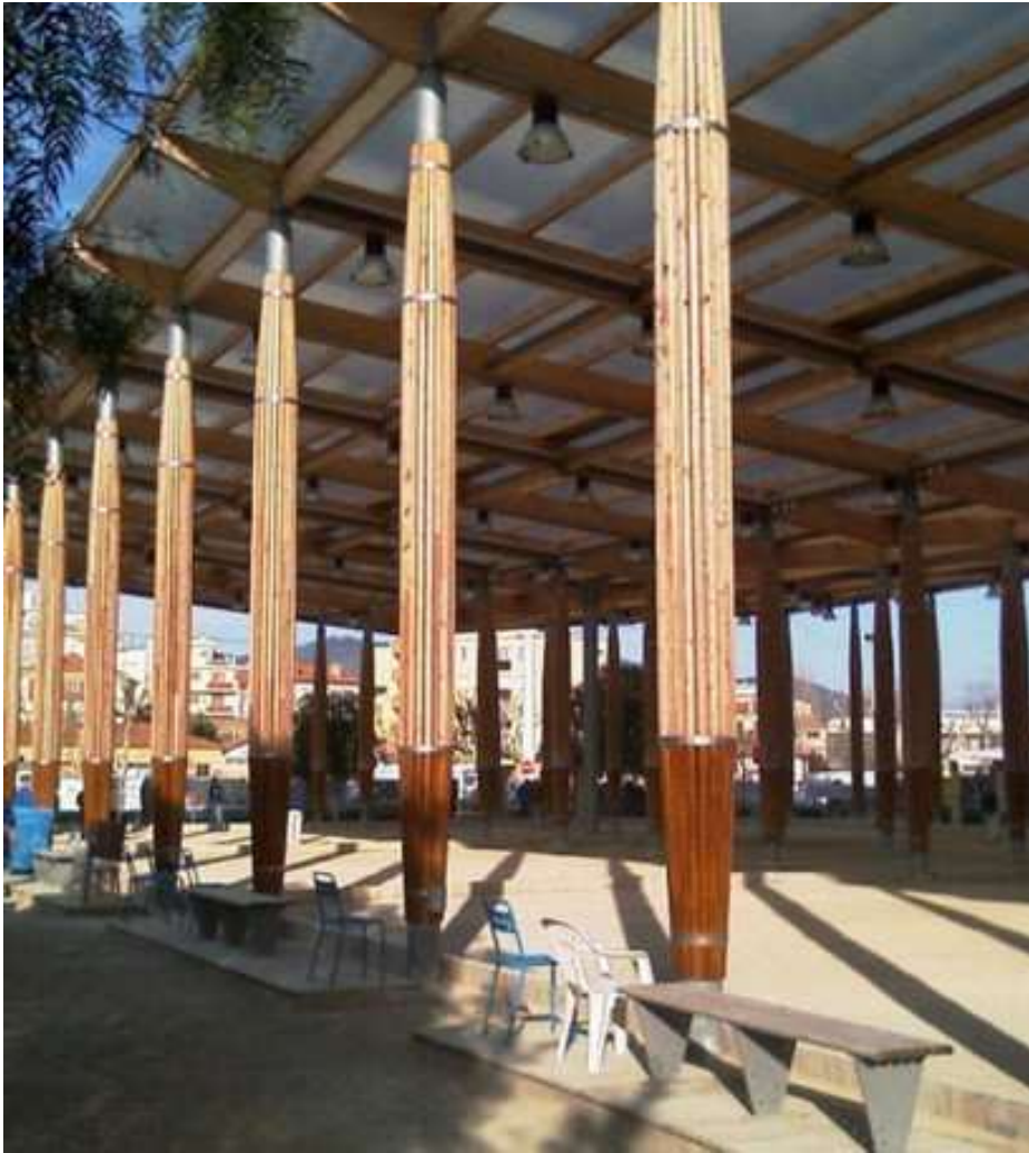
Le tout nouveau boulodrome de Cannes, érigé sur la place Troncy, où a eu lieu ce Championnat de France en 1971

Ce Championnat de France Doublette senior , s'est déroulé les 18 et 19 septembre 1971 à Cannes (06).