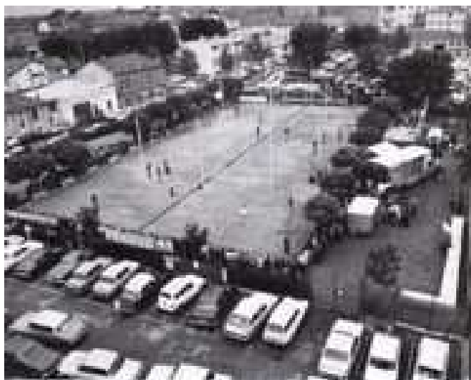
Une vue du site de ce Championnat de France le dimanche, après une pluie qui a rendu les terrains très lourds et gras