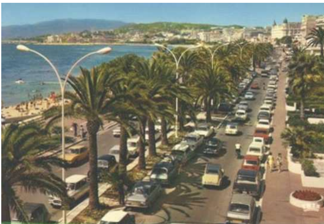
La ville de Cannes et sa célèbre Croisette dans les années 70

Ce Championnat de France Tête-à-tête senior pétanque , s'est déroulé les 18 et 19 septembre 1971 à Cannes (06).