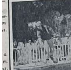
Pas de suspense pour la finale

Comme on le voit, les triplets tiennent à ce rassemblement. Nous nous inscrivons jusqu'au jeudi soir, et serons à la Boule du Tortoni, Café du Tortoni, Jean-Laurès, 12