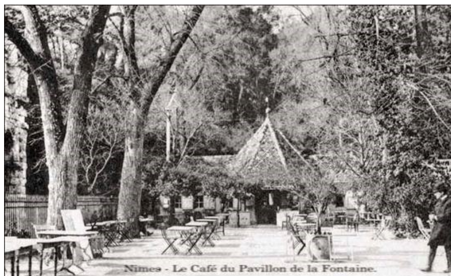
Le café du pavillon des Jardins de la Fontaine à Nîmes dans les années 50 (carte postale : Philippe Ritter)

Ce Championnat de France Triplette senior pétanque , s'est déroulé à Nîmes (30).