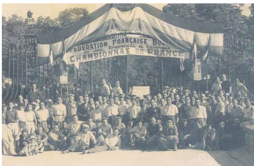
Les participants à ce Championnat, ont pris la pose, devant le portail, des jardins de la Fontaine