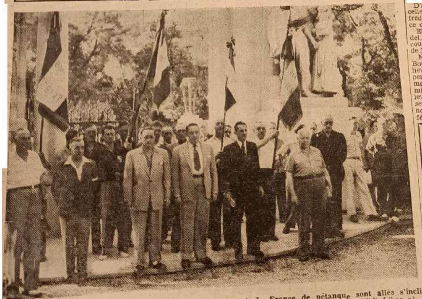
Les joueurs de boules ayant participé au championnat de France de pétanque sont allés s'incliner devant le monuments aux Morts.

...un Ce pe d hier mat cell cevi fort mè S qui cui S. po il de à le -