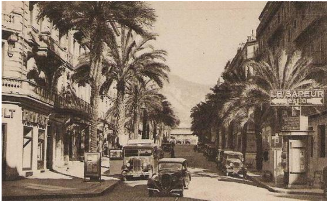
L'Avenue Colbert à Toulon en 1951

Ce Championnat de France Triplette senior pétanque , s'est déroulé à Toulon (83).