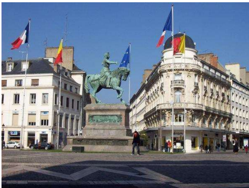
La Place Martroi à Orléans, avec la statue de Jeanne D'Arc, qui a délivré cette ville le 8 mai 1429

Pour la 3 ème édition, ce Championnat de France pétanque, est resté sur les bords de la Loire et après Joué-lès-Tours en 1976 et Nevers en 1977, c'est donc Orléans (45) qui a accueilli cette compétition Doublette féminin en 1978.