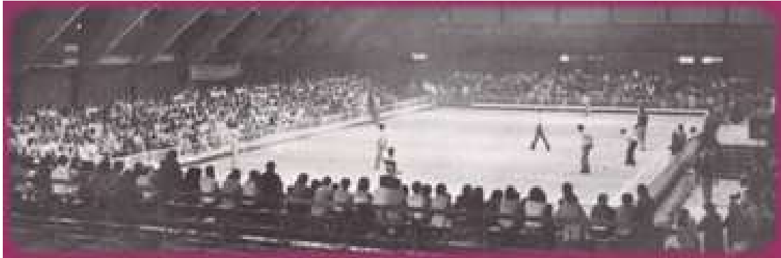
Une vue générale des terrains dans le hall Gascogne le dimanche après-midi