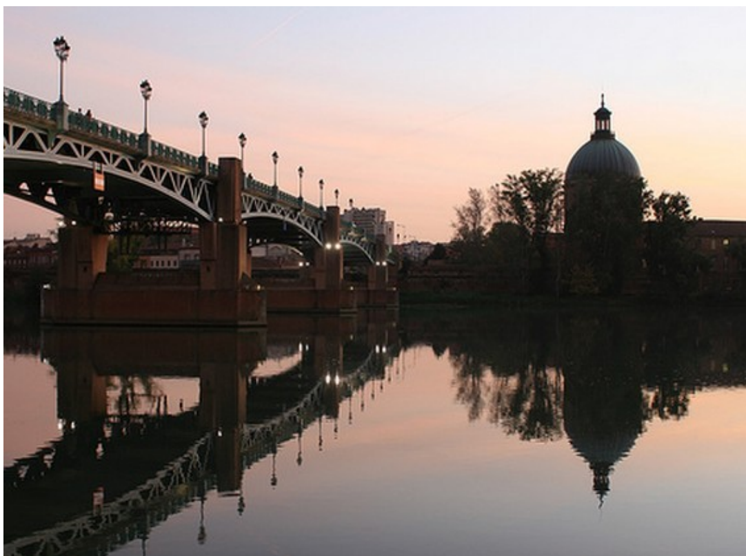
Le Dôme de l'hôpital de la Grave et le pont Saint-Pierre, vus de la fameuse place, où se sont déroulés les célèbres 3 jours de Saint-Pierre à Toulouse

Ce Championnat de France Tête-à-tête senior pétanque , s'est déroulé les 9 et 10 juillet 1977 à Toulouse (31).