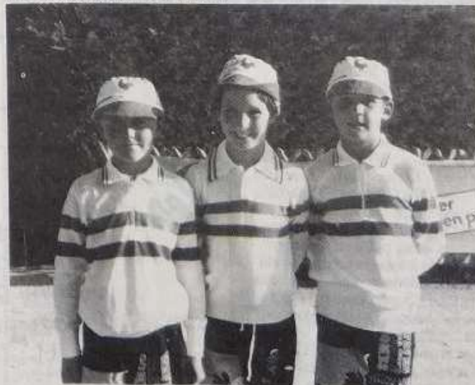
Champions de France minimes.