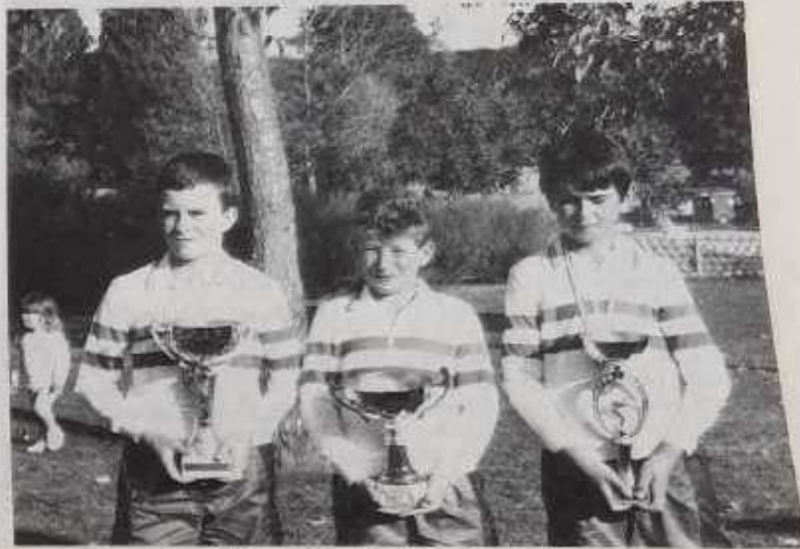
Champions de France cadets.