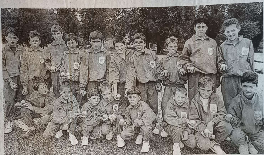
18 pétanqueurs, minimes et cadets, défendent les couleurs du Maine-et-Loire