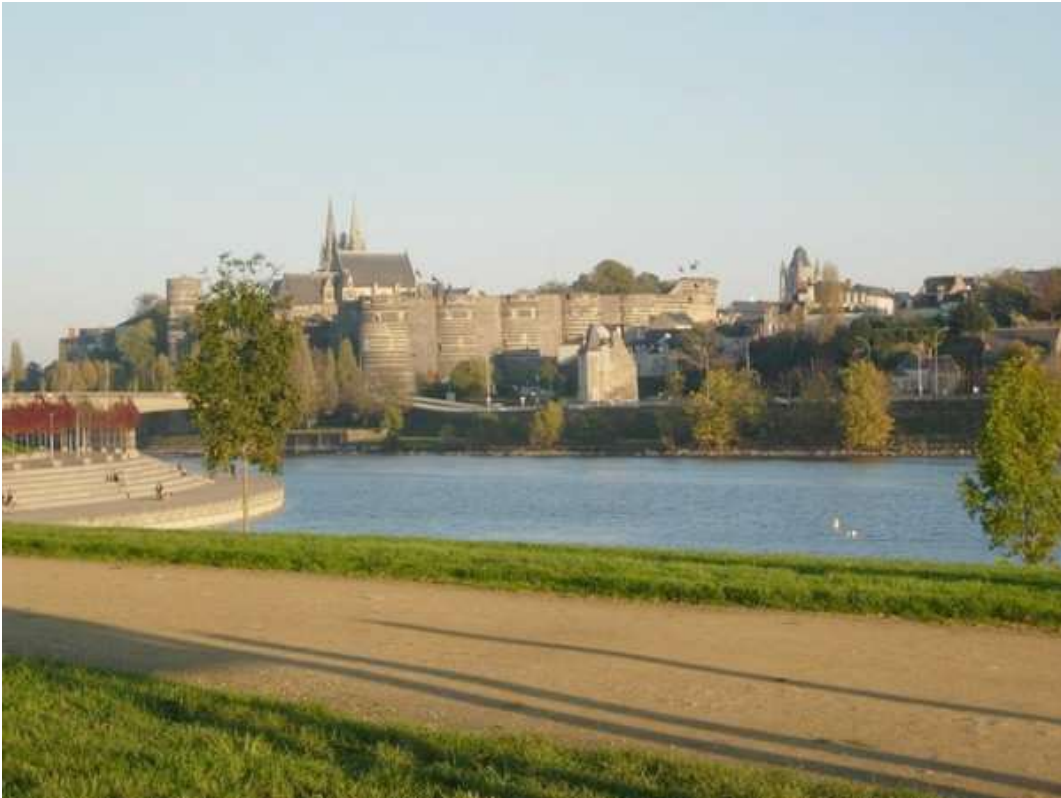
La ville d'Angers baignée par le Maine, avec en toile de fond son château et sa cathédrale

Ce Championnat de France Triplette cadet , s'est déroulé les 5 et 6 septembre 1992 à Angers (49).