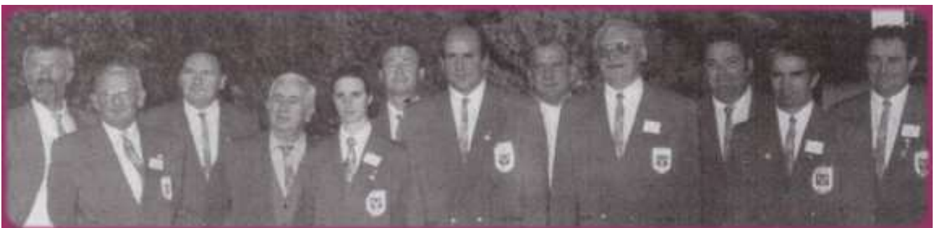
Le Comité d'Organisation du CD49 en 1992 à Angers