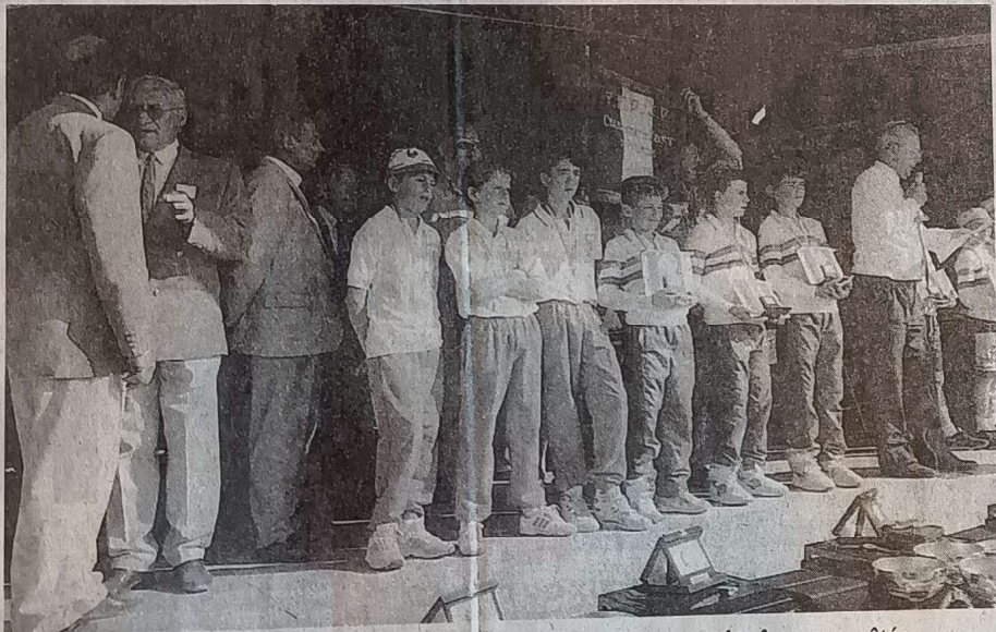
Les jeunes Angevins (à gauche) déçus mais valeureux quand même, aux côtés des champions de France

ENCOURAGEMENTS. — Venus en groupe et souvent en famille — parfois par cars entiers — les jeunes joueurs ont été vigoureusement encouragés pendant les deux jours de la compétition. Le tout a donné un ton chaleureux et gai à la rencontre.