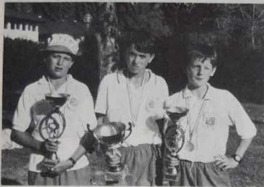
Sous-champions de France cadets.