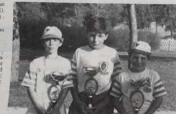
Sous-champions de France minimes.

Les joueurs du Maine-et-Loire qui ont réussi un superbe parcours, en particulier en 1/2 finale où ils ont fait carton plein, enthousiasmant le public tout acquis à leur cause, vont avoir quelques difficultés en ce début de partie. Ils craquent et les charentais prennent le large, menant 7 à 1, puis 7 à 2 et 8 à 2. Les joueurs d'Anjou se réveillent alors, d'abord en marquant 2 points, puis à la mène suivante 3, profitant d'une mauvaise