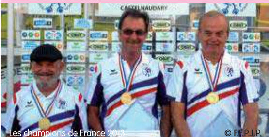
Les champions de France 2013