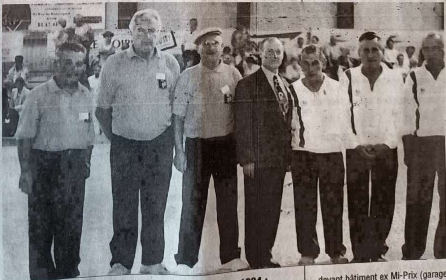
Les finalistes du Trophée National des vétérans 1994 : Coq (Chateaufrenard) contre Tchillian (Marseille).

Samedi 30 septembre, à partir de 14 heures, le CRB (cyclorandonneurs des Boutières) organise son 10 e challenge Léon Bernard. Épreuve UFOLEP ouverte à tous. Contre la montre individuel de 22 km, de St-Sauveur-de-Montagut au Cheylard. Inscriptions à partir de 13 h 15 à St-Sauveur et premier départ à 14 heures. Arrivée route de Valence