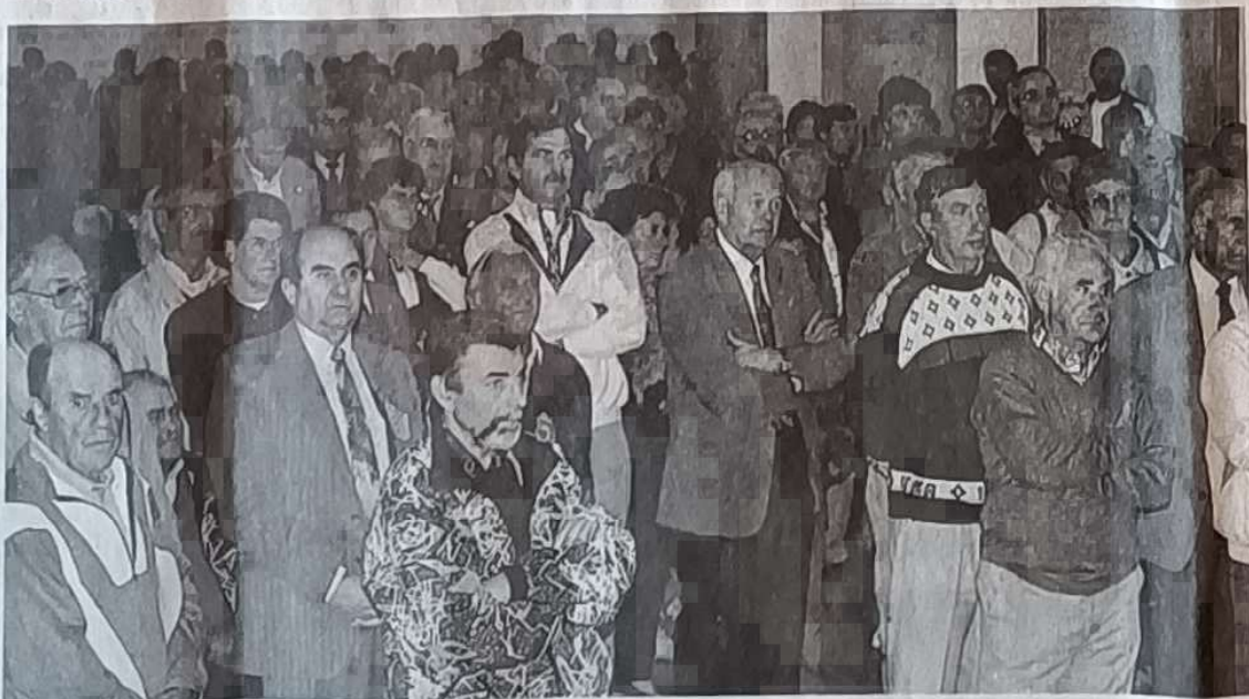
Les personnalités et les participants

"... Merci à tous ceux qui de près ou de loin ont concouru à faire de ce championnat une fête consacrée au jeu le plus populaire et le plus français qui soit... C'est un jeu plaisant, simple et instinctif, qu'on pratique pour le plaisir, chacun à