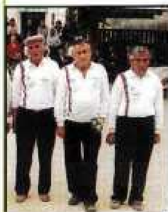
Les champions sortants échouent en demi après une partie fratricide.