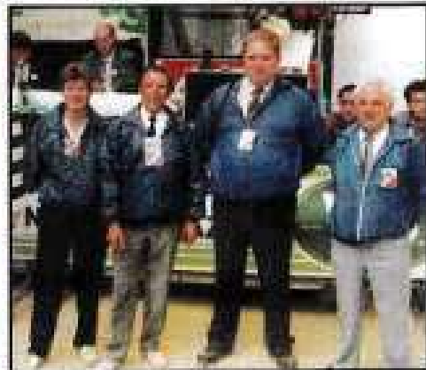
Parties sous l'œil avisé et expert du corps arbitral.