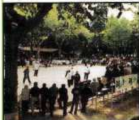
Vue générale du cadre d'honneur dans le superbe parc thermal.