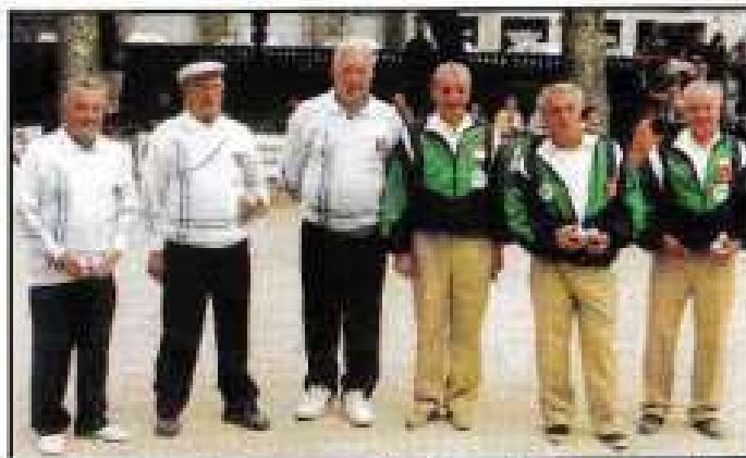
La demi-finale opposant l'équipe des Bouches-du-Rhône aux futurs finalistes du Tarn-et-Garonne.