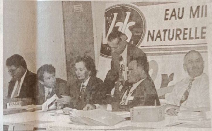
Les membres du comité d'organisation

Alors pourquoi ne pas supposer que Vals va vivre deux belles journées, pour un championnat qui fera anale dans le calendrier national de