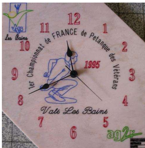
La pendule-souvenir de ce 1er Championnat de France vétéran à Vals-les-Bains en 1995

La ville thermale de Vals-les-Bains (07) a accueilli le 1er Championnat de France Triplette vétéran, qui fait suite aux 3 précédents Trophées Nationaux (de 1992 à 1994).