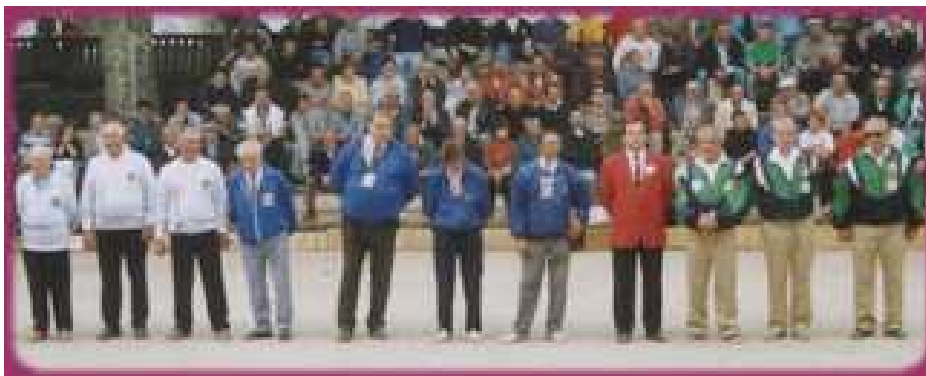
La présentation des 2 Triplettes vétéran Finalistes de ce Championnat à Vals-les-Bains (07) : de gauche à droite les futurs Champions du (13), en bleu le corps arbitral, puis les Finalistes (82)

A noter qu'en 1/2 finale on a retrouvé 4 Triplettes du Sud : trois du (13) et une du (82).