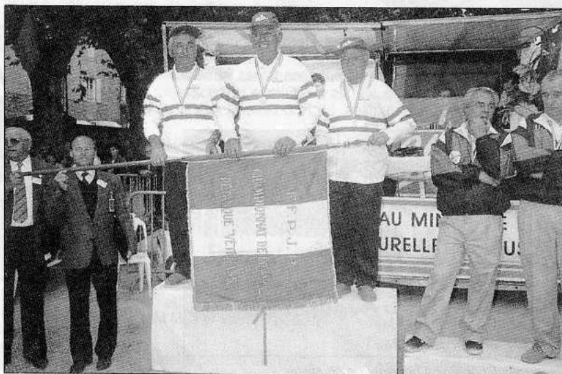
Des vétérans heureux comme des enfants, les champions de France 95.

Les quelque 1500 spectateurs qui garnissaient les tribunes installées dans le magnifique parc du Casino n'ont pas été déçus dans la mesure où les deux équipes finalistes pratiquèrent un jeu à la hauteur de l'événement. On pensait que le titre allait quitter le Sud-Est pour passer au Sud-Ouest. Les Tarnais, qui étaient menés 10-8 avaient le point sur le terrain et 5 boules en main, alors que leurs adversaires n'avaient plus aucune munition. On pensait à un gros coup. Hélas, Boucoiran tira le but et frappait sa propre boule et le point restait aux Méridionaux. La partie était