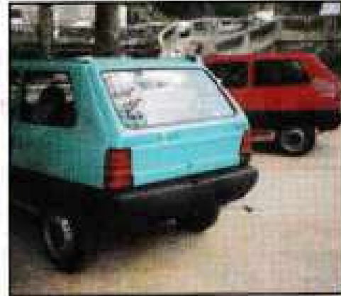
Les Seat Marbella venant récompenser les vainqueurs.