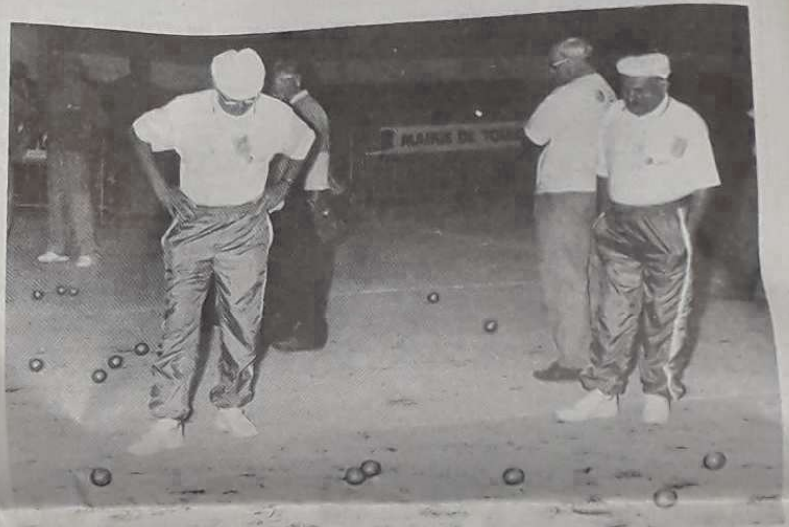
... en voici encore la preuve.