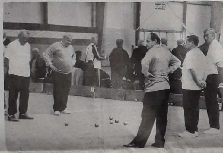
L'âge n'enlève rien à la qualité du jeu et à la précision des coups...

Le succès est au rendez-vous du Palais des congrès de Toulouse. Un concours de la trempe des grands. Aujourd'hui les finales.