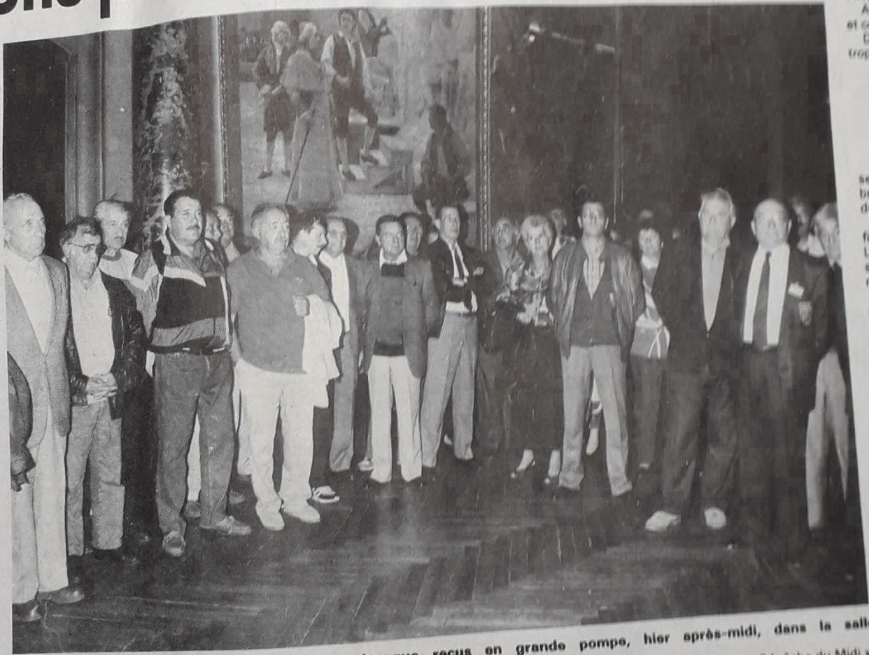
Les participants au premier National de pétanque reçus en grande pompe, hier après-midi, dans la salle des Illustres de la mairie de Toulouse.