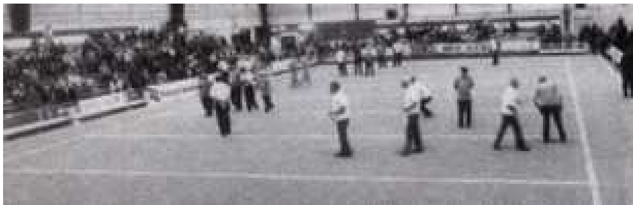
Une vue des 1/8 de finale de ce trophée National vétérân dans le carré d'honneur