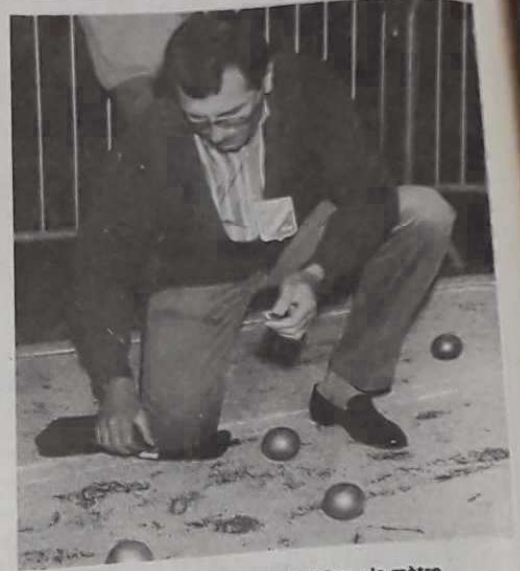
L'arme impitoyable de l'arbitre : le mètre.