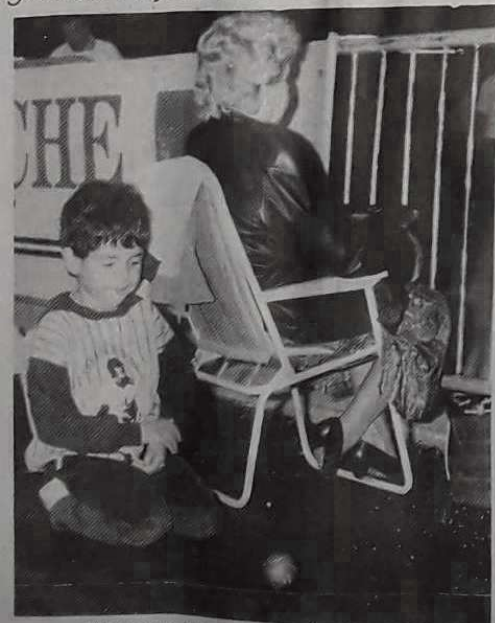
Si jeune et déjà sous l'emprise de la boule...