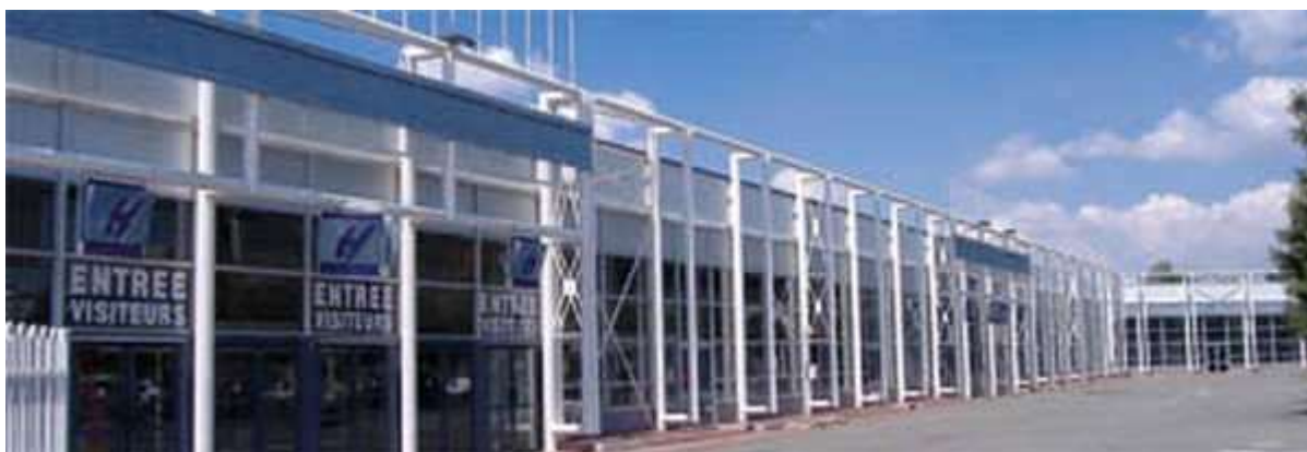
Le Parc des Expositions de Toulouse, cadre de ce 1 er Trophée National de Pétanque en 1992

Le 1 er Championnat de France Triplette vétérân , en 1992 à Toulouse, aura été en fait le 1 er Trophée National vétérân (jusqu'à sa 3 ème édition en 1994).