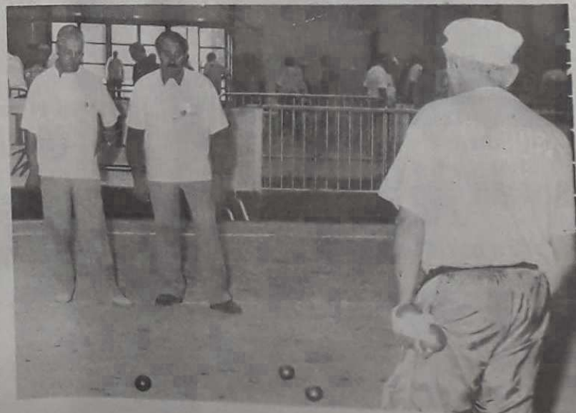
Celle-là, il va falloir que tu la tires...