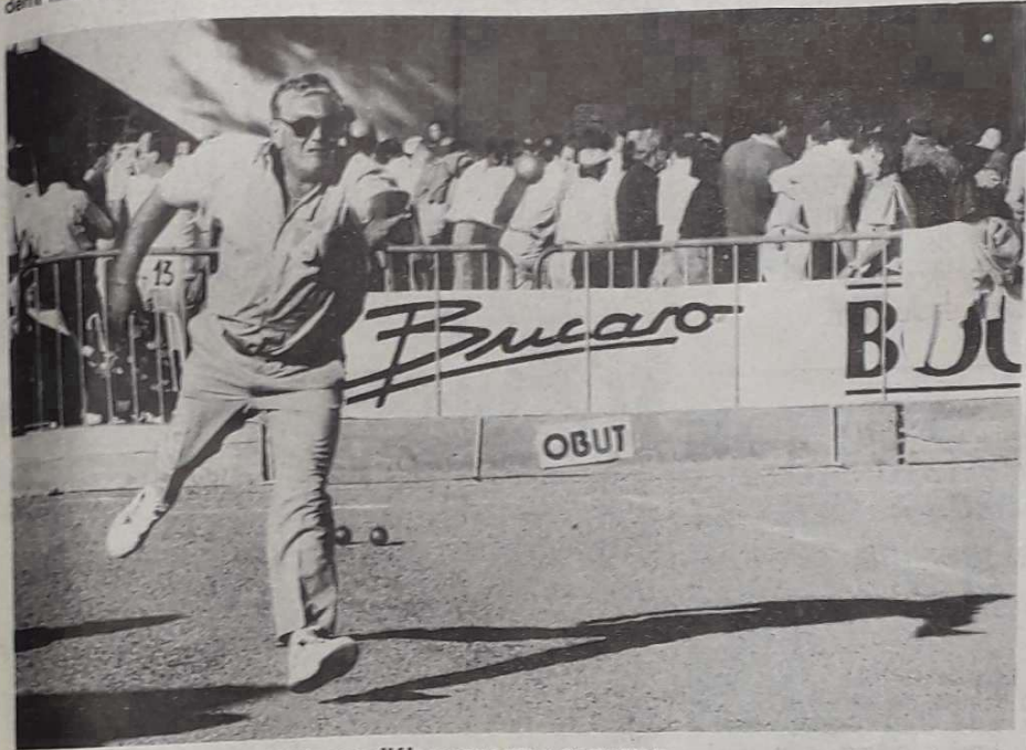
Trois pas d'élan pour un « carreau ».