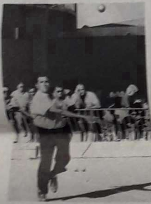
Concentré pour le tir.