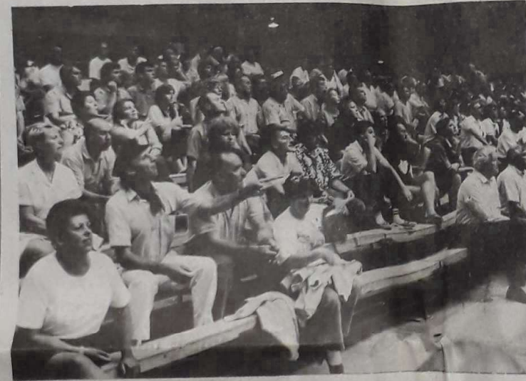
Public averti et passionné.

Les quarante-cinquième championnats de France de jeu provençal en triplette ont connu leur ultime affrontement, hier après-midi, au Parc des expositions de Toulouse en présence d'un bon public, très ouvert, si l'on en juge à ses réactions des choses de la boule.