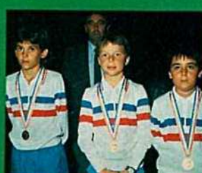
3 4 5