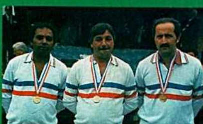
6 7 8