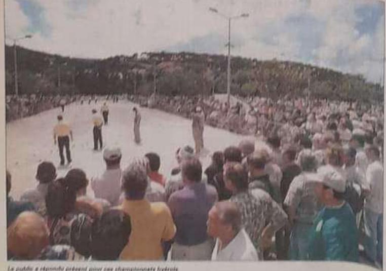
Le public a répondu présent pour ses championnats hyérois.