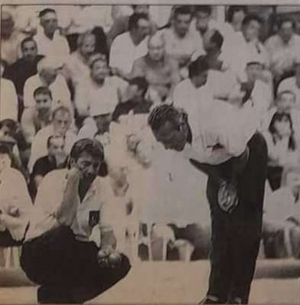
Bianconi et Massoni en réflexion.