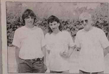
Prat - Estienne - Gras (B. des Iles Le Brus).