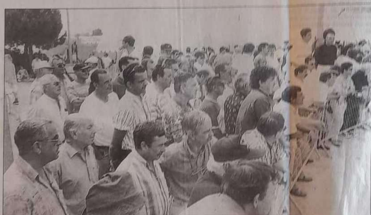
Un public venu tous les jours très nombreux.