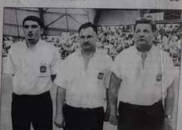
La solide formation venue du Calvados.