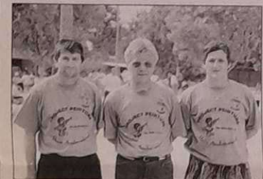
Muzi - Fargette - Ambrogiani (J.B. Hyéroise).