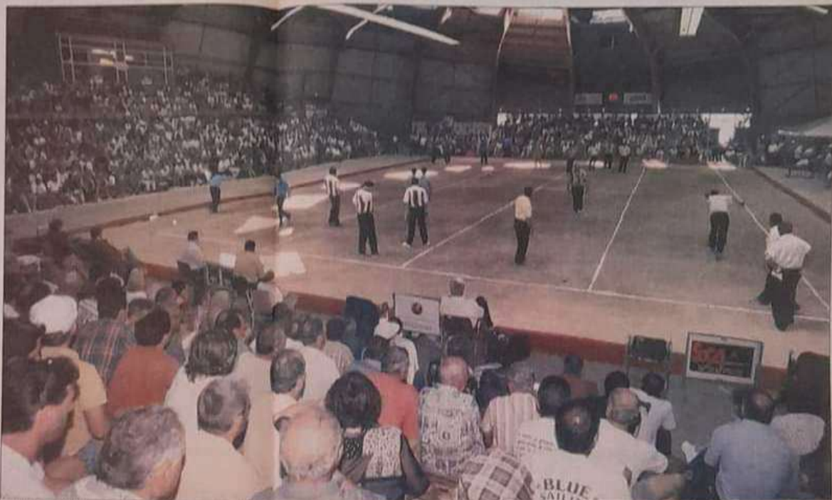
Les quarts de finale du championnat de France ont tirés à l'Espace 3000 un cadre à leur mesure