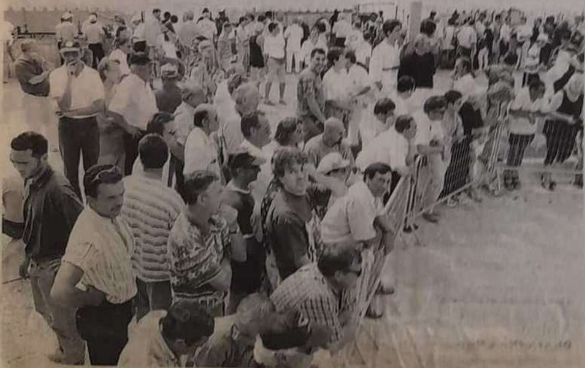
Les phases finales ont attiré des milliers de spectateurs sur le parking de l'Espace 3000.