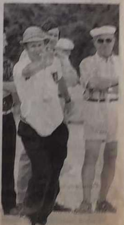
Les Arcs ont perdu en 1/8e de finale