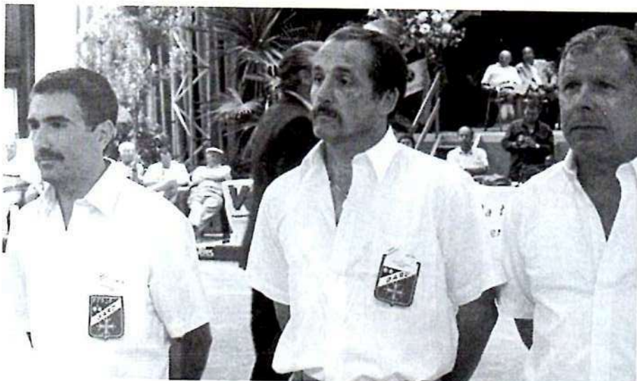
Les champions de France.