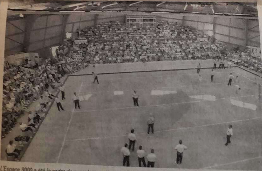
L'Espace 3000 a été le centre de toutes les attentions