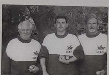
Zattera - Palumbo - (Bouyon).