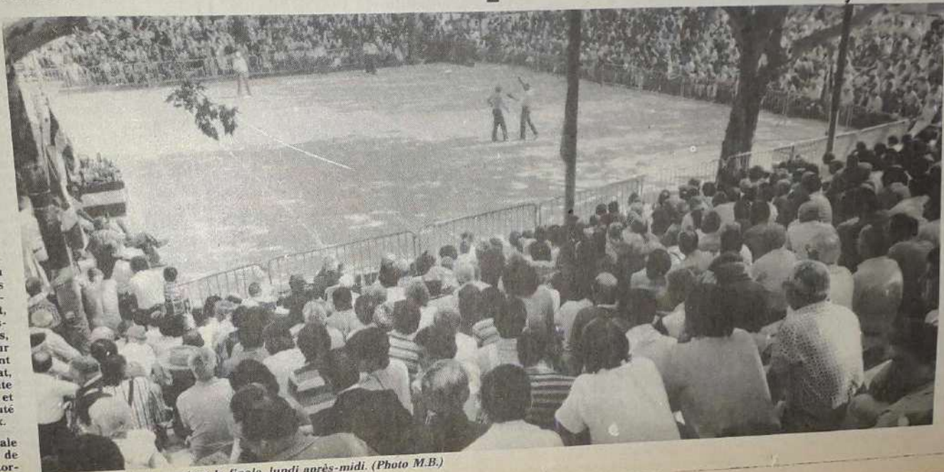
Une vue générale pendant la finale, lundi après-midi.