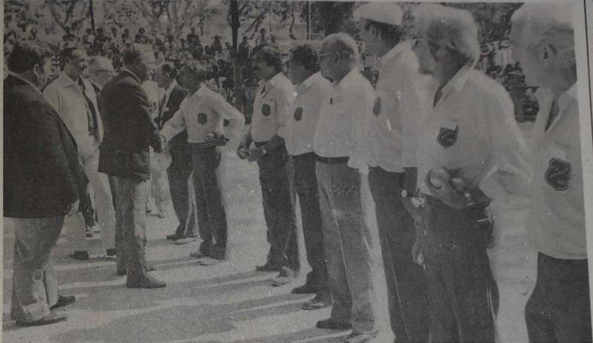
Pendant la présentation des finalistes.

A associer dans cette parfaite réussite, la municipalité avignonnaise qui avait consenti de très gros efforts pour que la cité des papes soit à la hauteur du championnat de France. Les nouveaux jeux des allées de l'Oulle et le carré d'honneur furent particulièrement soignés. Le responsable du comité du Var souhaitait pouvoir faire aussi bien l'année prochaine à Draguignan. Avignon