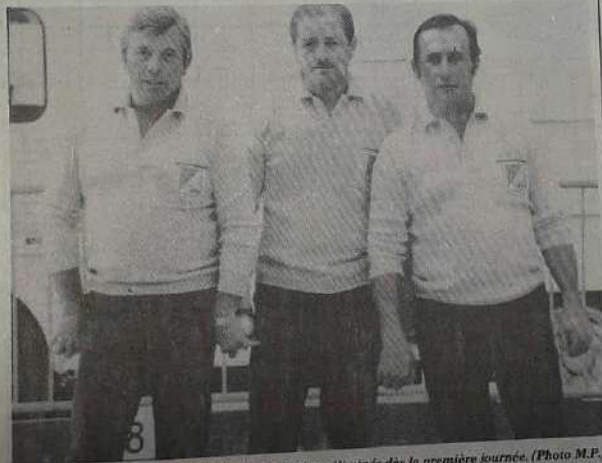
Carbo (Pertuis) fut l'un des dix-huit Vauclusiens éliminés dès la première journée.

Le pulb vaclusien devrait découvrir un joueur complet et peu bavard.