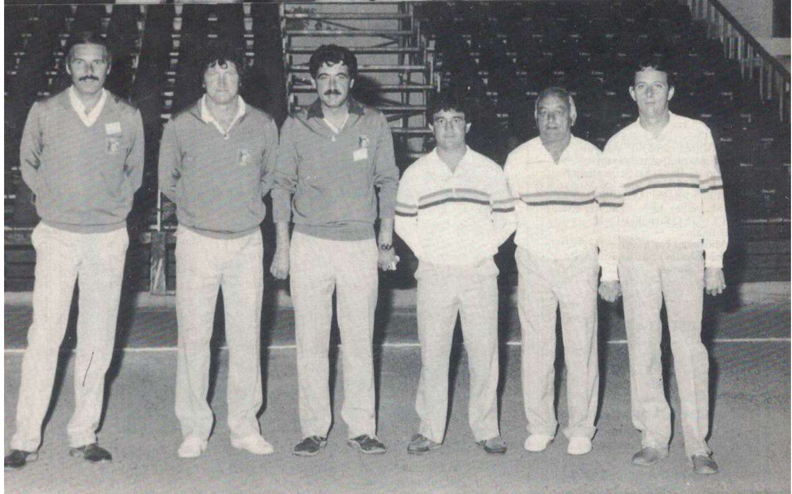
Dans notre prochain numéro : les 39ème Championnats de France triplete jeu provençal de Grenoble.