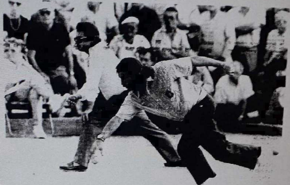
Le jeu provençal, toujours spectaculaire et très apprécié du public.

Ce sport qui persiste à conserver jeune.