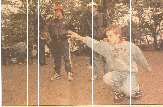
385 triplettes minimes, cadets et juniors vont en découdre pendant 48 heures au Mans

Simple anecdote au regard de toute l'organisation logistique de cette compétition d'importance qui ne réside pourtant pas au plaisir de la livrer au lecteur intéressé (elle nous fut racontée par le président