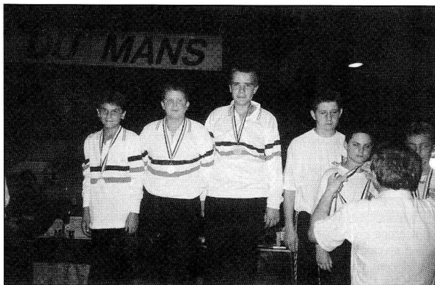
Champions et vice champions cadets