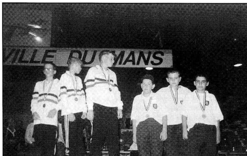
Champions et vice champions minimes