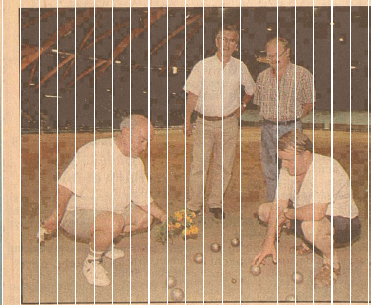
Un travail colossal pour une « première », mais, sous le vaste plafond de la Rotonde, le bulldozer ainsi réalisé est à la hauteur des espérances.

« C'est pour cela qu'en partenariat technique avec la Ville du Mans, nous avons choisi de transformer la Rotonde et bulldozer. C'est une sécurité de savoir que, quel qu'il advienne, les phases finales des championnats pourront se dérouler en toute sérénité (l'immeuble) ».