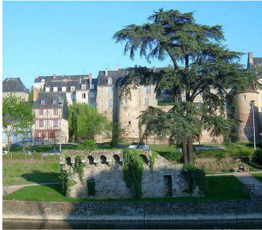
La muraille Gallo-Romaine de la cité Plantagenêt, le quartier historique du Vieux Mans

Ce Championnat de France Triplette junior , s'est déroulé les 23 et 24 août 1997 au Mans (72).